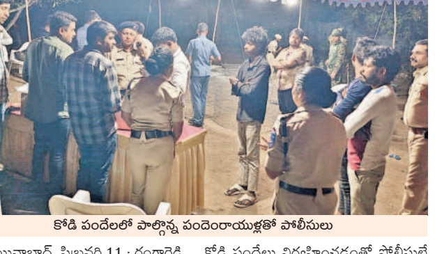
కోడి పందెంలో పాల్గొన్న పందెం రాయుళ్లతో పోలీసులు

మొయినాబాద్, ఫిబ్రవరి 11 : రంగారెడ్డి జిల్లా మొయినాబాద్ మండల పరిధిలోని సామంత్ క్షేత్రంలో భారీగా మోచారించడంతో కోడి పందెం నిర్వహించారు. భూపతిరాజు శివ రెండు తెలుగు రాష్ట్రాలకు చెందిన వ్యక్తులు పెద్దఎత్తున కోడి పందెం నిర్వహిస్తున్నారని అనుమానం వ్యక్తం చేశారు. కోడి పందెం నిర్వహించారు. కోడి మంగళవారం రాత్రి దాడులు నిర్వహించారు. కోడి పందెం అడుతున్నారని తెలియడంతో రాజేంద్రుల డి.సీ.పి శ్రీనివాస్, చేపేళ్ల డి.సీ.పి, మొయినాబాద్ సీఐ పనులను మూలరెడ్డి తమ 50 మంది సిబ్బందితో కోడి పందెం నిర్వహించారు. పోలీసులు కోడి పందెంలో పాల్గొన్న 64 మంది పోలీసులు అదుపులోకి తీసుకుని మొయినాబాద్ పోలీస్ స్టేషన్ కు తరలివచ్చారు.