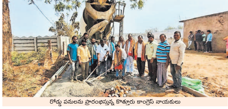
రోడ్డు పనులు ప్రారంభిస్తున్న కొత్తూరు కాంగ్రెస్ నాయకులు

సిటీబ్యూరో, ఫిబ్రవరి 11 : అధికారంలో ప్రజాప్రతినిధులలో ప్రారంభించాల్సిన అభివృద్ధి పనులను కాంగ్రెస్ నాయకులు ప్రారంభిస్తున్నారు. పనుల ప్రారంభ సమయంలో ఉండాలని అధికారుల జాడ కనిపించడంలేదు. గ్రామాల్లో సర్పంచులు, ఎంపీటీసీలు లేకపోవడంతో ప్రత్యేక అధికారులతో పాటు సమస్యను దిద్దు. అయితే గ్రామంలో ఏ అభివృద్ధి పని జరిగినా దాన్ని ప్రారంభించాల్సిన మండల అధికారులు, పర్వవేక్షించాల్సిన గ్రామ ప్రత్యేక అధికారులు పాల్గొనడంలేదు. అభివృద్ధి పనుల్లో కాంగ్రెస్ నాయకులు నూతన ఒరవడికి తీరకారం చదుతు