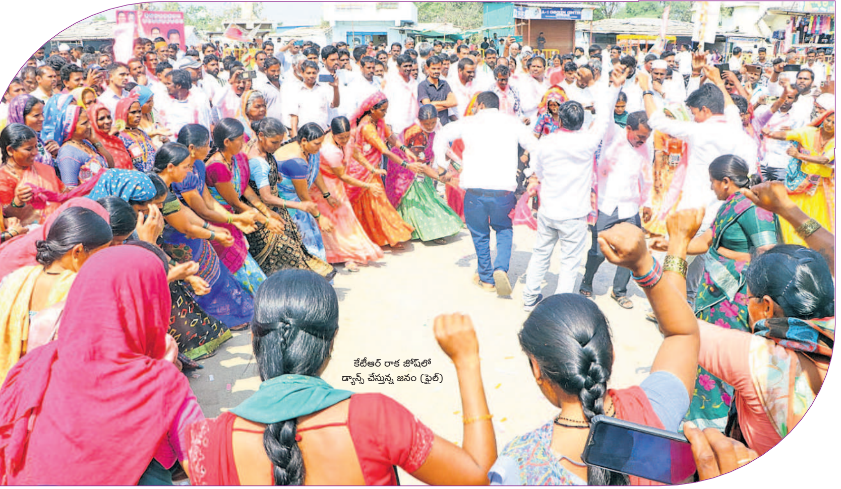
కేటీఆర్ రాక జోషిలో డ్యాన్స్ చేస్తున్న జనం (ఫైర్)