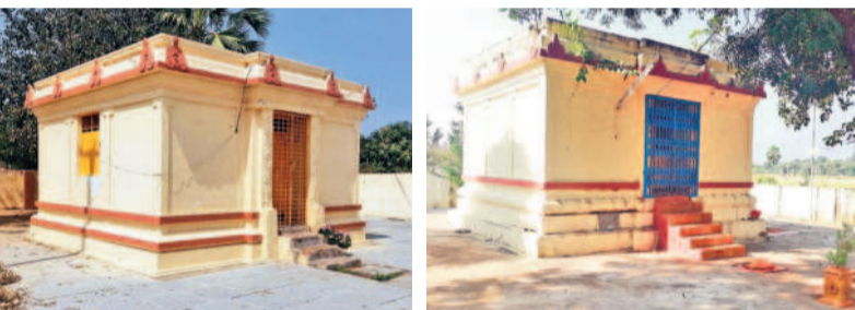
మిసీ జాతరకు సిద్ధమైన మేడారంలోని సమృద్ధి పూజా మందిరం, కన్నవల్లిలోని సారలమ్మ పూజా మందిరం