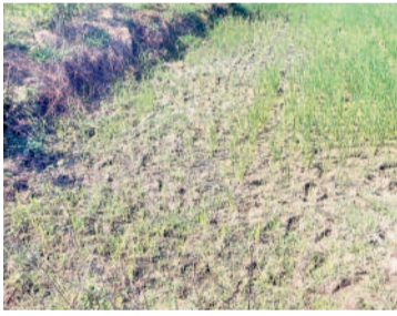
వర్షానికి భూగర్భ జలాలు అడుగంటడంతో ఎండిన పంట

గత కేసీఆర్ ప్రభుత్వ హయాంలో కాల్యు తవ్వకం దావరి జలాలు విడుదల చేయడంతో మండు చేసిన లోసూ చెరువులు, కుంటలు మళ్ళీ కరువు తలపెట్టాయి. వాగుపై నిర్మించిన చెక్ డాంట్లలో ఏడాదంతా పుష్కలంగా నీరుండేది. ఫలితంగా భూగర్భ జలాలు పెరిగి బావులు, బోర్లు నీటితో కళకళలాడేవి. దీంతో భూములన్నీ చచ్చి పొలాలు అడవిగా మారాయి. భక్తుల రద్దీకి అనుగుణంగా ఉదయం 8 గంటల నుంచి మేడారానికి బస్సులు నడుపుతున్నట్లు, ప్రత్యేక బస్సుల అవరేషన్ నిర్వహణకు హనుమకొండ, మేడారం బస్సులలో ఆర్డీసీ అధికారులు 24 గంటలు అందుబాటులో ఉంటారని పేర్కొన్నారు. అన్ని ఎక్స్ ప్రెస్, పల్లె వెలుగు బస్సుల్లో మహిళలు, అడవిల్లలకు మహిళ లక్ష్మి పథకం వర్తిస్తుందని, ఉచితంగా ప్రయాణం చేయవచ్చని తెలిపారు. జాతర బస్సుల చార్జీలు ఎక్స్ ప్రెస్ రూ.200(పెద్దలు), రూ.110( పిల్లలు), ఈ-ఎక్స్ ప్రెస్ రూ.210(పెద్దలు), రూ. 120( పిల్లలు) ఉంటుందని ఆర్ఎం తెలిపారు.