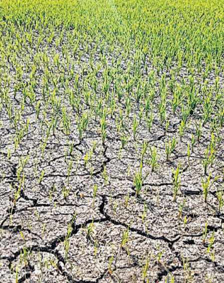
జనగామ రూరల్: సిద్దిలిలో నీళ్ళ లేక బీటలు వాలన ముస్తాబు వెంకటయ్యకు చెందిన వరిపాలం, (ఇనిసీట్) పంటను మేస్తున్న ఆవు

అవకేతంకల సేవల్లోని ప్రభుత్వం చేర్చులు కాశీబుగ్గ, ఫిబ్రవరి 11 : వరంగల్ ఎన్ఎమ్ఎల, జనగామ వ్యవసాయ మార్కెట్ కార్యదర్శులు పోలీస్ నిర్ణయం, సంగీనీ వ్యవసాయ సస్పెన్షన్ చేస్తూ రాష్ట్ర మార్కెట్ కోశాఖ కమిషనర్ ఉదయకుమార్ మంగళవారం ఉత్తర్వులు జారీ చేశారు. రాష్ట్ర వ్యాప్తంగా ఏడుగురిని సస్పెన్షన్ చేయగా, అందులో వరంగల్, జనగామ కార్యదర్శులున్నారు. అక్టోబర్ నుంచి సీనియర్ అధ్యక్షులతో మద్దతు ధరతో పట్టి కొనుగోళ్ళు చేస్తున్న విషయం తెలిసింది. ఈ క్రమంలో వ్యవసాయ అధికారులు జారీ చేసిన లీల నిర్బంధిత అవకేతంకల జరుగుతున్న వ్యూహాల్లో దుర్వర్తన కేసులు తెలిపారు. జనగామ మార్కెట్ పరిధిలో 4,500, వరంగల్లో 176 లీల నిర్బంధిత ధరల్లో తేడాలున్నట్లు తెలిసింది. కాగా సస్పెన్షన్ మార్కెట్ సెక్టర్ టీ. రెడ్డికి వరంగల్ ఇన్చార్జ్ బాధ్యతలు అప్పగించారు.