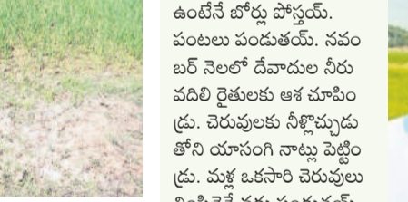
పాలకర్త వరిసారాల్లో నీళ్ళ లేక ఎండుతున్న వరి పాలం

భూగర్భ జలాలు అడుగంటే పాలాలు ఎండిపోతున్నాయి. సాగునీళ్ళు అందక బీటలు వారుతున్న పంటలను చూసిన రైతులకు కన్నీళ్ళే బిక్కవుతున్నాయి. రిజర్వాయర్లలో నీళ్ళున్నా విడుదల చేయకపోవడంతో చెరువులకు నీళ్ళు రాక ఎండిపోయి వరి చేలలోకి పశువులను మేక వడలాల్సిన పరిస్థితులు నెలకొన్నాయి. ముఖ్యంగా పాలకర్త నియోజకవర్గంలో పాటు చాలాచోట్ల 500 ఫీట్ల వరకు బోర్లు వేసినా నీళ్ళు రాని పరిస్థితి నెలకొంది. సమైక్య రాష్ట్రంలో జిల్లా మారిన పంట పాలాలు స్వరాష్ట్రంలో కేసీఆర్ చౌరపతో వచ్చు మారిన సమీపం తలపించగా నేడు కాంగ్రెస్ ప్రభుత్వం రాకతో మళ్ళీ ఎన్నటి రోజులే దాపురించాయని రైతులు ఆవేదన చెందుతున్నారు. సాగునీళ్ళు లేక అల్లూడుతున్న రైతులు కేసీఆర్ పాలనను గుర్తుచేసుకుంటూ ఈ కరువు పరిస్థితులు ఎప్పుడు పోతాయోని ఎదురుచూస్తున్నారు.