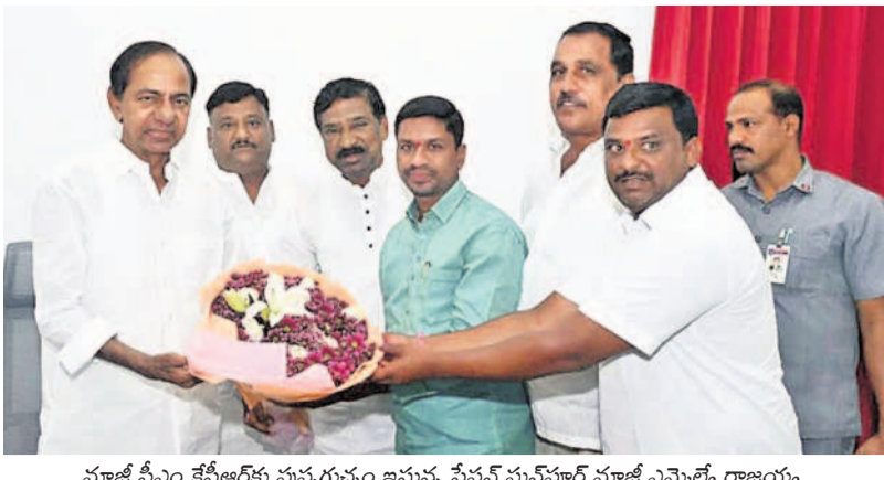
మాజీ సీఎం కేసీఆర్ కు పుష్కరపుష్పం ఇస్తున్న స్టేషన్ ఘనపూర్ మాజీ ఎమ్మెల్యే రాజయ్య, మాజీ జడ్పీటీసీ కీర్తి వెంకటేశ్వర్లు, సీనియర్ నాయకుడు మల్లికార్జున రాజేశ్వర్ల రెడ్డి ఆదిత్యులు