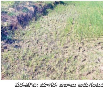
వర్షానికి: భూగర్భ జలాలు అడుగుంటుండే అంచిన పంట

గత కేసీఆర్ ప్రభుత్వ హయాంలో కాల్యూ తవ్వకం ద్వారా జలాలు విడుదల చేయడంతో మంచు వేసవిలోనూ చెరువులు, కుంటలు మళ్ళీ కనిపించాయి. వారుపై నిర్మించిన చెక్కెండ్లలో ఏడాదా వుప్పులగా నీరుండేది. ఫలితంగా భూగర్భ జలాలు పెరిగి బావులు, బోర్లు నీటితో కళకళలాడాయి. దీంతో భూములున్న చెరువులు నిండా నీళ్ళుండడంతో రైతులు పడవ పడ్డ భూములను సైతం సాగులోకి తీసుకొచ్చి వ్యవసాయాన్ని పండుగా మార్చారు. ఇతర రాష్ట్రాల నుంచి కూలివచ్చి ఇక్కడ పనులు చేసేవారు. కాంగ్రెస్ సర్కారులో ప్రస్తుతం అలాంటి పరిస్థితులు లేవు. ఎక్కడి పాలాలు అక్కడే పంటలు సాగుచేయక మళ్ళీ పడవగా మారి తెలంగాణ రాక ముందటి రోజులకు తలపెట్టుకున్నాయి.