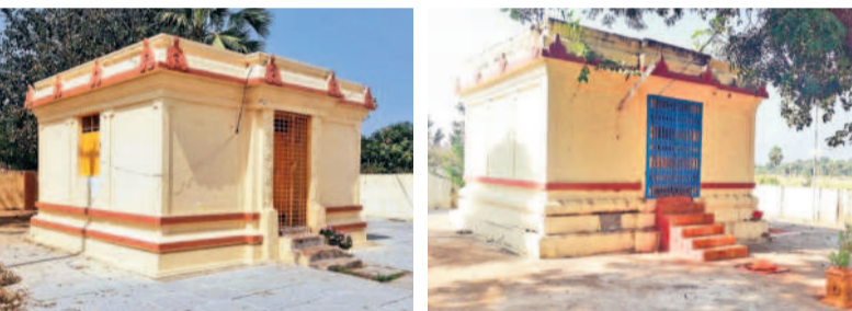
మిసీ జాతరకు సిద్ధమైన మేడారంలోని సమృద్ధి పూజా మందిరం, కన్నెపల్లిలోని సారలమ్మ పూజా మందిరం