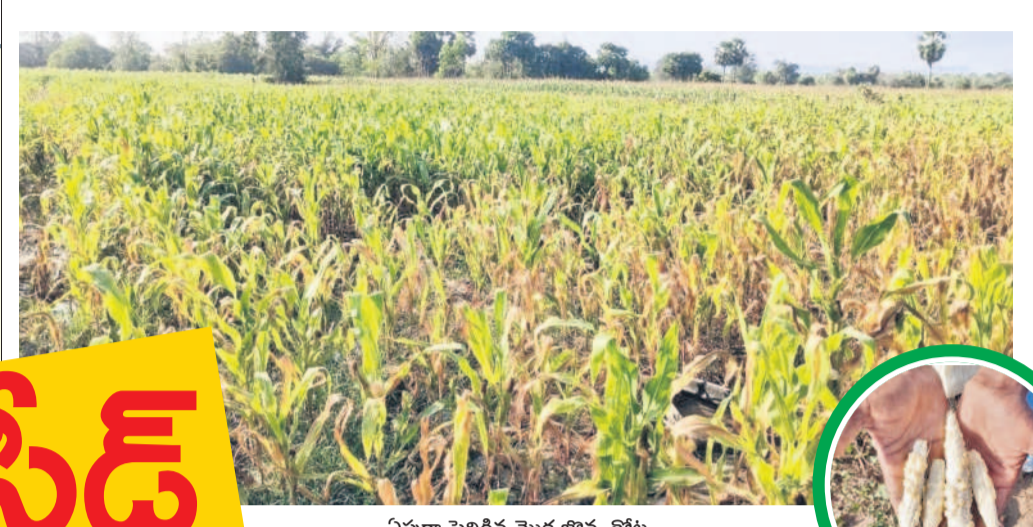
విపూగా పెరిగిన మొక్కజొన్న తొట