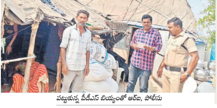
పట్టుకున్న పీడీఎస్ బియ్యంతో ఆరబ, పోలీసు

మోర్లాడ్, ఫిబ్రవరి 12: పేదలకు అందాల్సిన పీడీఎస్ బియ్యన్ని కొందరు అక్రమారులు పక్కదారి పట్టిస్తున్నారు. జిల్లాలో గుట్టుగా సేకరించిన పీడీఎస్ బియ్యన్ని రాష్ట్ర సరిహద్దులు దాటించి అందిన కాక్కిలి దోపిడీకులు స్వాధీనం చేసుకుంటున్నారు. కమర్షియల్ మండలం గాంధీనగర్ కేంద్రంగా ఓ పక్క పీడీఎస్ బియ్యన్ని అక్రమంగా తరలిస్తున్నట్లు స్థానికుల నుంచి ఆరోపణలు వెల్లువెత్తుతున్నాయి. అధికారులను మర్చిపో గాంధీనగర్ నుంచి పీడీఎస్ బియ్యన్ని మహారాష్ట్రకు తరలిస్తున్నా, సదరు వ్యక్తికి ఎన్ని ఫిర్యాదులు వచ్చినా, అధికారులు ఇప్పటివరకు ఎలాంటి చర్యలు తీసుకోలేదని గ్రామస్థులు ఆరోపిస్తున్నారు. గాంధీనగర్ కేంద్రంగా పీడీఎస్ బియ్యన్ని అక్రమంగా తరలిస్తున్నా అధికారులు ఎందుకు చర్యలు తీసుకోవడంలేదనే ప్రశ్నలు ఉత్పన్నమవుతున్నాయి. ఇందుకు మండల, జిల్లా స్థాయి నుంచి చెక్ పోస్టు అధికారులకు రంగం గా నెలనెలా మామూలు ముట్టడమే కారణమనే సమాధానం వస్తున్నది. పెద్దమొత్తంలో బియ్యం అక్రమ రవాణా జరుగుతున్నా అధికారులు మాత్రం తమకు ఏమీ తెలియనట్లుగా వ్యవహారాన్ని నార్సేనే విమర్శలు ఉన్నాయి.