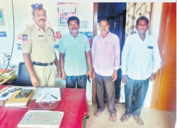
బిక్కునూర్ పీడీఎస్ మున్నూరు కాపు సంఘ నాయకులు

బియ్యం/బిక్కునూర్, ఫిబ్రవరి 12: తమ డిమాండ్లు సరవేర్చాలని కోరుతూ మున్నూరు కాపులు బుద్ధవారం తలపెట్టిన 'సీఎం రేపంపెరెడ్డి ఇంటి ముట్టడి' కార్యక్రమాన్ని పోలీసులు అడ్డుకున్నారు. బియ్యం, బిక్కునూర్ మండలం రాష్ట్రసరిహద్దులో మున్నూరు కాపులను పోలీసులు ముందస్తు అరెస్టు చేసి, స్టేషన్లకు తరలించారు. ఈ సందర్భంగా నాయకులు మాట్లాడుతూ.. రూ.5వేల కొట్టెలో మున్నూరు కాపు రాజు అనుకుంటే అధికారులు ముట్టడి చేయాలి. నెరవేర్చాలని కోరారు. లేకుంటే స్థానిక సంస్థల ఎన్నికల్లో కాంగ్రెస్ పార్టీని బొందవెడతామని హెచ్చరించారు. కులగణనలో పీడీఎస్ తక్కువగా చూపించడం