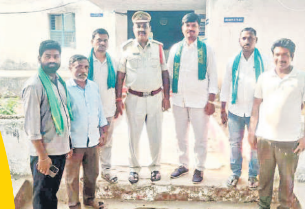
బియ్యంలో మున్నూరు కాపుల ముందస్తు అరెస్ట్

బియ్యం/బిక్కునూర్, ఫిబ్రవరి 12: తమ డిమాండ్లు సరవేర్చాలని కోరుతూ మున్నూరు కాపులు బుద్ధవారం తలపెట్టిన 'సీఎం రేపంపెరెడ్డి ఇంటి ముట్టడి' కార్యక్రమాన్ని పోలీసులు అడ్డుకున్నారు. బియ్యం, బిక్కునూర్ మండలం రాష్ట్రసరిహద్దులో మున్నూరు కాపులను పోలీసులు ముందస్తు అరెస్టు చేసి, స్టేషన్లకు తరలించారు. ఈ సందర్భంగా నాయకులు మాట్లాడుతూ.. రూ.5వేల కొట్టెలో మున్నూరు కాపు రాజు అనుకుంటే అధికారులు ముట్టడి చేయాలి. నెరవేర్చాలని కోరారు. లేకుంటే స్థానిక సంస్థల ఎన్నికల్లో కాంగ్రెస్ పార్టీని బొందవెడతామని హెచ్చరించారు. కులగణనలో పీడీఎస్ తక్కువగా చూపించడం