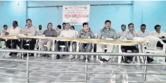
ఎన్నికల శిక్షణ తరగతులో మాట్లాడుతున్న డిప్యూటీ సీనియర్

బాన్సువాడ రూరల్, ఫిబ్రవరి 12 : తరగతులో జరగనున్న పంచాయతీ ఎన్నికల నిర్వహణపై డిప్యూటీ సీనియర్ అధికారులు తదితరులు పాల్గొన్నారు.