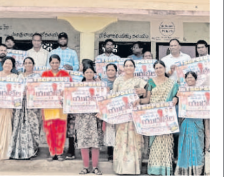
యుద్ధభేరి పోస్టర్లు అవిష్కరిస్తున్న ఉపాధ్యాయులు