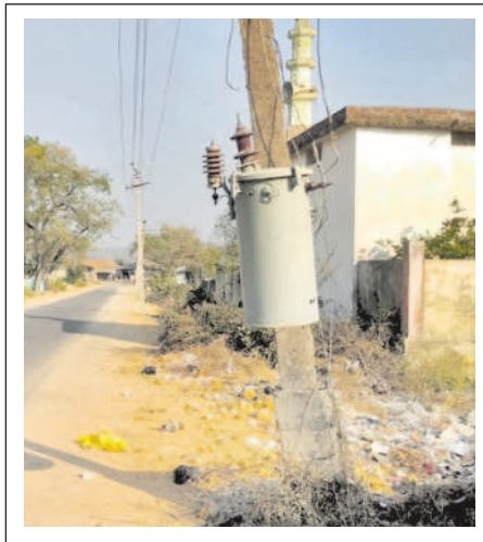
బోర్డం కార్యాలయ ప్రధాన రహదారి పక్కన ప్రమాదకరంగా ఉన్న విద్యుత్ ట్రాన్స్ఫార్మర్

పవన్ ట్రాన్స్ఫార్మర్ గ్రామస్థులు, రోడ్డు గుండా వెళ్లే వాహన దారులు, పశువులకు ప్రమాదం పొందింది. రోడ్డు విస్తరణలో భాగంగా బీటీ రోడ్డు ఎత్తు పెంచడంతో విద్యుత్ స్తంభానికి బిగించిన ట్రాన్స్ఫార్మర్ ఎత్తు తగ్గి ప్రమాదకరంగా మారింది. విద్యుత్ స్తంభం సైతం శిథిలపడడంతో వేగ వేగంగా అవకాశం ఉంది. విద్యుత్ స్తంభం కింద భాగంలో కాంట్రీ వేన్ పడిపోకుండా చేశారు. ఈ రోడ్డు గుండా విద్యుత్ సిబ్బంది కాపాకరుల సాగి స్తుంటారు. కానీ వారు తమకేమీ పట్టనట్లు వ్యవహరించడంతో ట్రాన్స్ఫార్మర్ గ్రామస్థులకు ప్రమాదం పొందింది. సంబంధిత ఉన్నతాధికారులు చొరవ తీసుకొని కొత్త విద్యుత్ స్తంభం ఏర్పాటు చేసి ట్రాన్స్ఫార్మర్ ను పైకి బిగించేలా చర్యలు తీసుకోవాలని గ్రామస్థులు కోరుతున్నారు.