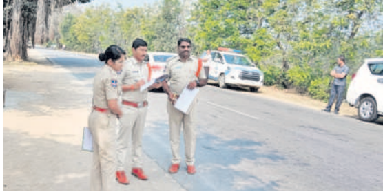
సిబ్బందితో కలిసి ప్రమాద స్థలాలను పరిశీలిస్తూ అదనపు ఎస్పీ

వాహనార్ధి, ఫిబ్రవరి 12 : రోడ్డు ప్రమాదాల నివారణకు చర్యలు తీసుకుంటూ ఉన్న అదనపు ఎస్పీ చైతన్యారెడ్డి అన్నారు. గత ఏడాది నుంచి కార్యక్రమం - సిరిసిల్ల రహదారి పై ప్రమాదాల జరిగిన ప్రదేశాలను ఆమె బుధవారం పరిశీలించారు. సందర్భిత అధికారులతో కలిసి ప్రమాదానికి గల కారణాలను అడిగి తెలుసుకున్నారు. రోడ్డు, భవనాల అధికారులతో కలిసి ప్రమాద నివారణకు చర్యలు చేపట్టనున్నట్లు తెలిపారు. ఆమె వెంట కార్యక్రమాలలో సీబి రామన్, ఎస్పి అనిల్ కన్నారావు.