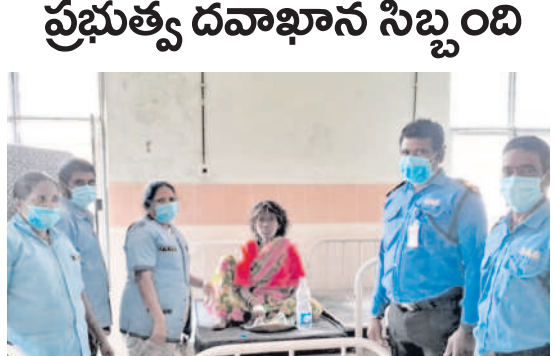
ఎల్లారెడ్డి ప్రభుత్వ దవాఖానలో అనారోగ్యంతో ఉన్న గుర్తు తెలియని మహిళకు సేవలు అందిస్తున్న వైద్య సిబ్బంది