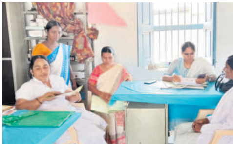
రికార్డులను పరిశీలిస్తున్న అధికారి ఉపకేంద్రం