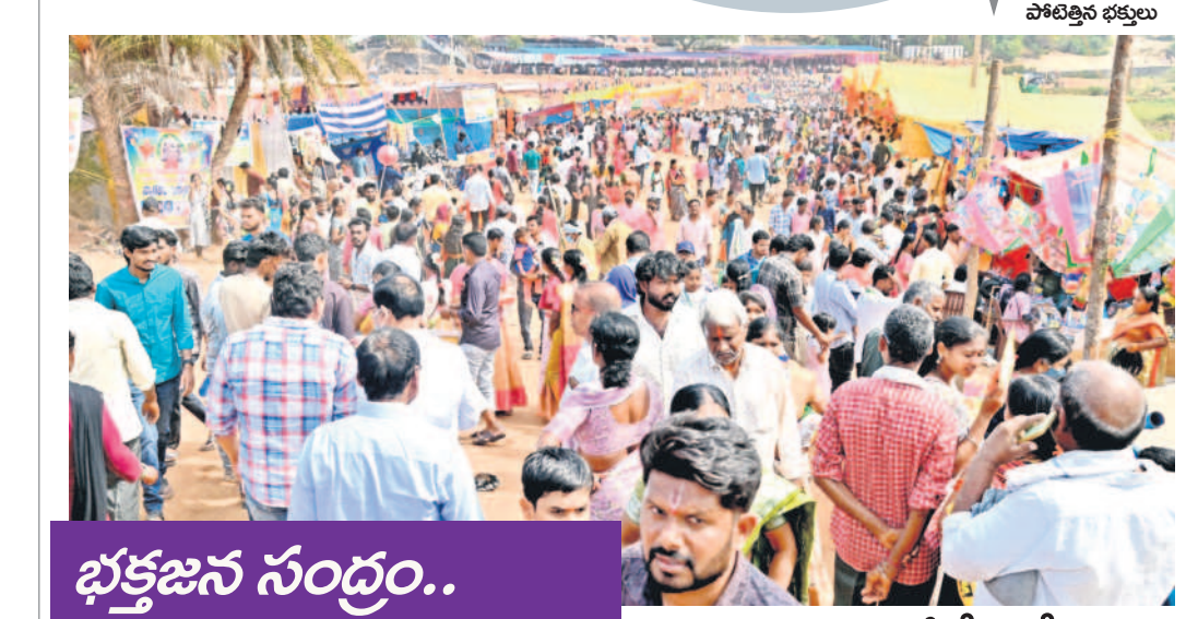
గంగాపూర్ జాతరకు పోటిల్లిన భక్తులు