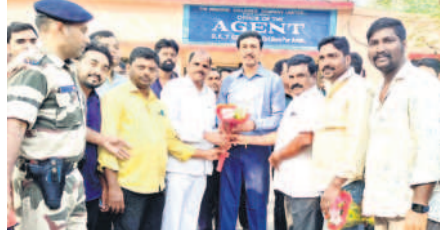
సీఎండీకి వున్న గుర్తు లందిస్తున్న టీబీజీవీఎస్ నాయకులు