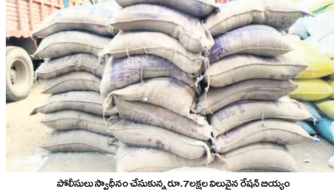
పోలీసులు స్వాధీనం చేసుకున్న రూ. 70 లక్షల విలువైన రేషన్ బియ్యం

బియ్యం అక్రమ రవాణాపై పోలీసులు, ఇతర అధికారులతో ఒప్పందం చేసుకున్న స్పగ్గర్ల మద్దతు జరిగిన సంభాషణ సోషల్ మీడియాలో ఛైరట్గా మారింది. పేదలకు ఉచితంగా అందించాల్సిన రేషన్ బియ్యాన్ని మహారాష్ట్రకు అక్రమంగా తరలించడమే వ్యక్తిగత మార్కుకున్న సంబంధిత అధికారులను ముగ్గిం