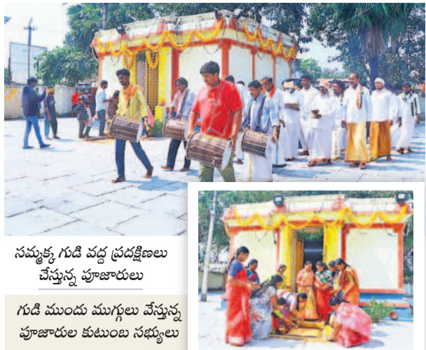
సమృద్ధి గుడి వద్ద ప్రదక్షిణలు చేస్తున్న పూజారులు