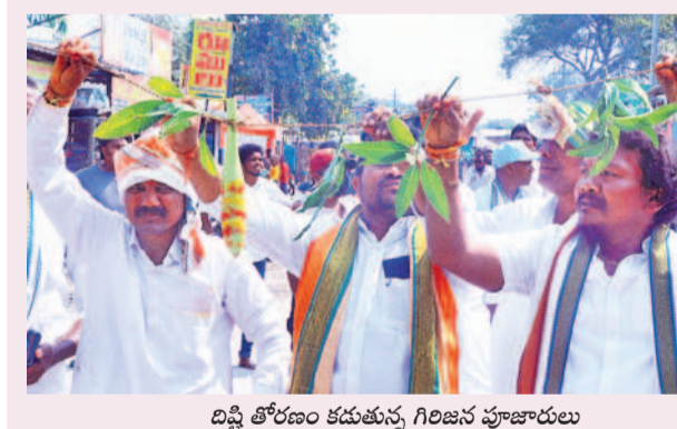
దిష్టి తోరణం కడుతున్న గిరిజన పూజారులు

ములుగు, ఫిబ్రవరి 12 (సమస్త తెలంగాణ) : బుద్ధవారం ప్రారంభమైన మినీ జాతరకు భక్తులు తక్కువ సంఖ్యలో హాజరయ్యారు. జాతర ప్రారంభమయ్యే ముందు రోజు లక్షలాది భక్తులు మేడారం పరిసర ప్రాంతాలకు చేరుకొని గుడారాలు వేసుకుంటారు. కానీ ఈసారి అది కనిపించలేదు. గత మినీ జాతర సందర్భంగా