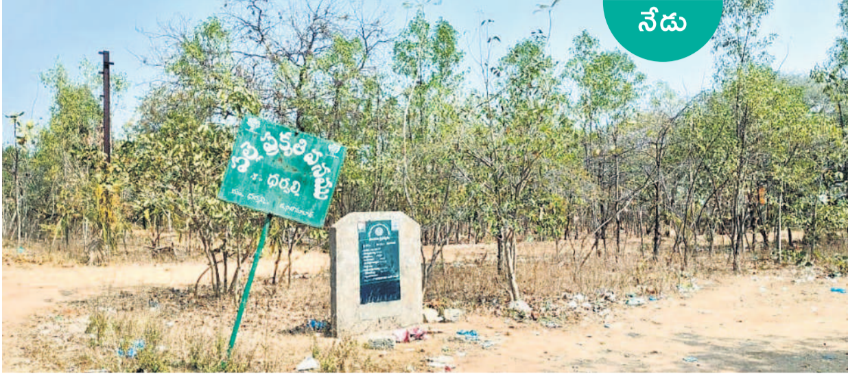
నేడు కళ తప్పి కళావిహీనంగా మారిన పచ్చని ప్రకృతి వనం