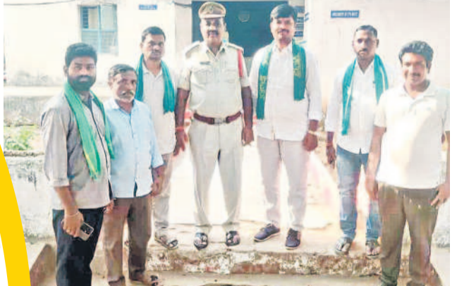
బియ్యంలో మున్నూరు కాపుల ముందస్తు అరెస్ట్

బియ్యం/బిక్కునార్, ఫిబ్రవరి 12: తమ డిమాండ్లు సరవేరైనా కొందరు మున్నూరు కాపులు బుద్ధవారం తలపెట్టిన 'సీఎం రేపంబెర్డి ఇంటి ముట్టడి' కార్యక్రమాన్ని పోలీసులు అడ్డుకున్నారు. బియ్యం, బిక్కునార్ మండలం రాష్ట్రసరిహద్దులో మున్నూరు కాపులను పోలీసులు ముందస్తు అరెస్టు చేశారు.