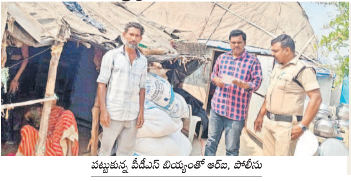
పట్టుకున్న పీడీఎస్ బియ్యంతో ఆరవ, పోలీసు

మోర్లాడ్, ఫిబ్రవరి 12: పేదలకు అందాల్సిన పీడీఎస్ బియ్యన్ని కొందరు అక్రమారులు పట్టుకుంటున్నారు. జిల్లాలో గుట్టుగా సేకరించిన పీడీఎస్ బియ్యన్ని రాష్ట్ర సరిహద్దులు దాటి అందిన కాక్టిల్ డోసుకుంటున్నారు. కమర్షియల్ మండలం గాంధీనగర్ కేంద్రంగా ఓ వ్యక్తి పీడీఎస్ బియ్యన్ని అక్రమంగా తరలిస్తున్నట్లు స్థానికుల నుంచి ఆరోపణలు వెల్లువెత్తుతున్నాయి. అధికారులను మర్చిచేసి గాంధీనగర్ నుంచి పీడీఎస్ బియ్యన్ని మహారాష్ట్రకు తరలిస్తున్నా, సదరు వ్యక్తికి ఎన్ని ఫిర్యాదులు వచ్చినా, అధికారులు ఇప్పటివరకు ఎలాంటి చర్యలు తీసుకోలేదని గ్రామస్థులు ఆరోపిస్తున్నారు. గాంధీనగర్ కేంద్రంగా పీడీఎస్ బియ్యన్ని అక్రమంగా తరలిస్తున్నా అధికారులు ఎందుకు చర్యలు తీసుకోవడంలేదనే ప్రశ్నలు ఉత్పన్నమవుతున్నాయి. ఇందుకు మండలం, జిల్లా స్థాయి నుంచి చెక్ పోస్టు అధికారులకు రంగుగా నిలవాలా మామూలు ముట్టడమే కారణమనే సమాధానం వస్తున్నది. పెద్దమొత్తంలో బియ్యం అక్రమ రవాణా జరుగుతున్నా అధికారులు మాత్రం తమకు ఏమీ తెలియనట్లుగా వ్యవహరిస్తున్నారనే విమర్శలు ఉన్నాయి.