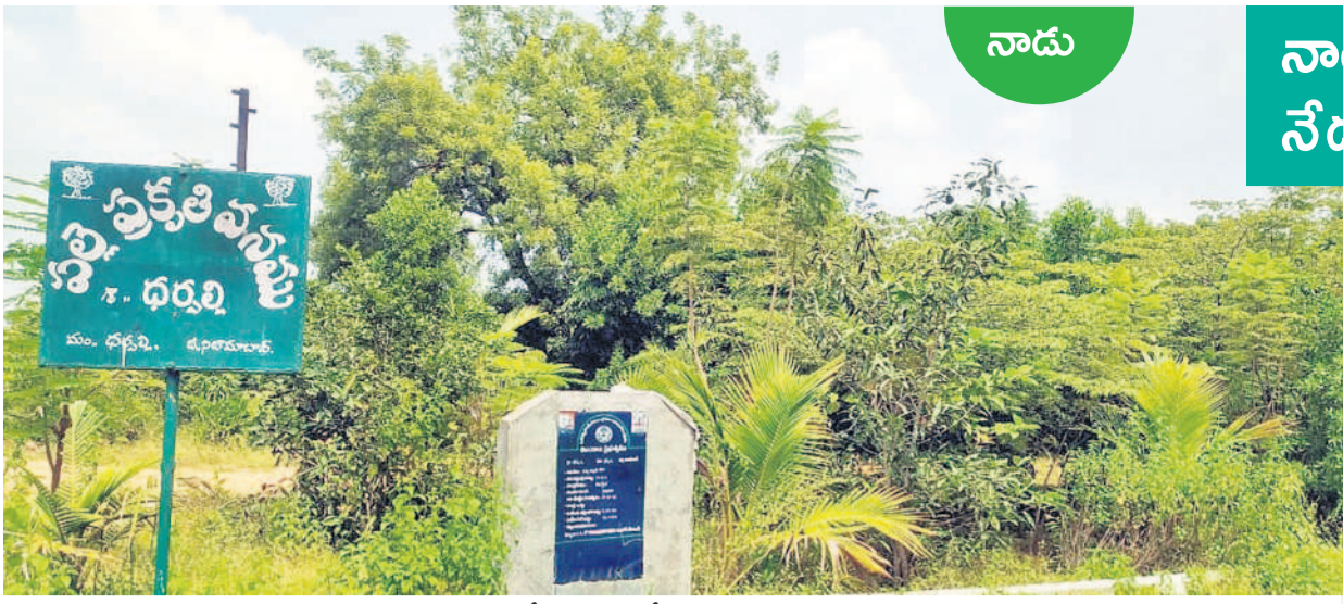
2022లో వచ్చని చెట్లతో అభివృద్ధి చెందిన పచ్చని ప్రాంతం