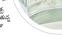
చికిత్స పొందుతున్న రాజు

పీడీఎస్ బియ్యం అక్రమ రవాణా చేస్తున్న వ్యక్తి జిల్లాలోని చాలా మంది అధికారులకు మామూలు ముట్టడమే కారణమనే సమాధానం వస్తున్నది. పెద్దమొత్తంలో బియ్యం అక్రమ రవాణా జరుగుతున్నా అధికారులు మాత్రం తమకు ఏమీ తెలియనట్లుగా వ్యవహరిస్తున్నారనే విమర్శలు ఉన్నాయి.