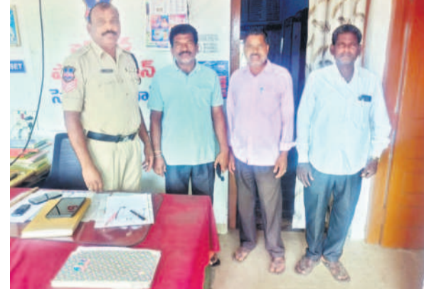
బిక్కునార్ పీడీఎస్ బియ్యం కాపు సంఘ నాయకులు