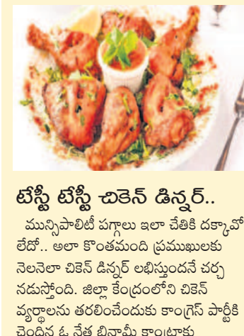
టోస్టి టోస్టి చికెన్ డిస్సర్..

మున్సిపాలిటీ హాలు ఇలా చేతికి దక్కావో లేదో.. అలా కొంతమంది ప్రముఖులకు నెలనెలా చికెన్ డిస్సర్ లభిస్తుంది చర్చ నడుస్తోంది. జిల్లా కేంద్రంలోని చికెన్ వ్యర్థాలను తరలించేందుకు కాంగ్రెస్ పార్టీకి చెందిన ఓ నేత బీనామీ కాంట్రాక్టు