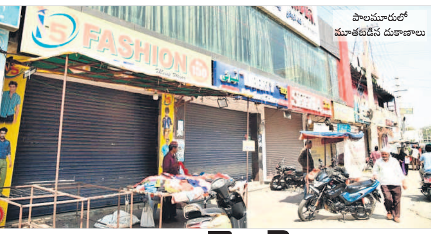
పాలమూరులో మూతపడిన దుకాణాలు

దక్కించుకున్నారు. ఇదే వ్యర్థాల తరలింపుకు కూడా ప్రకటించారు. మళ్ళీ ఏమైందో ఏమో కానీ బెండర్ రద్దయి అతనికే తిరిగి అప్పగించారు. దీంతో మున్సిపాలిటీలోని ఒకరిద్దరూ నాయకులతో పాటు కాంగ్రెస్ ప్రజాప్రతినిధులకు ప్రతినిధిల వికెన్ డిస్సర్ రూపంలో వెతుకుండడం చర్చనీయాంశంగా మారింది. సడన్గా స్పెషల్ ఆఫీసర్ పాలన రావడంతో చికెన్ డిస్సర్ ఒకరిద్దరికే పరిమితమైందని మాజీ నాయకులు బాధపడుతున్నారు. నగర పాలక సంస్థలో అంతా ఆఫీసర్ చేతుల్లోకి వెళ్ళడంతో.. ఒక ఆఫీసర్ నాకు చికెన్ డిస్సర్ కావాలని పట్టుబడుతున్నాడట.. నగర పాలక సంస్థలో ఇప్పుడు ఈ చికెన్ డిస్సర్ హాట్ హాట్ టాపిక్ మారింది.