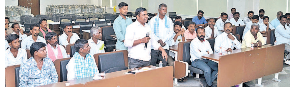
వికారాబాద్ జిల్లా కలెక్టరేట్లో గురువారం నిర్వహించిన సమావేశంలో పాల్గొన్న లగచర్ల రైతులు

వికారాబాద్, ఫిబ్రవరి 13, (నమస్తే తెలంగాణ): సీఎం రేవెంట్ రెడ్డి సొంత నియోజకవర్గం పాపులార్ మిర్యాలగూడ రైతులను అధికారులు బెదిరిస్తున్నారనే ఆరోపణలు వినిపిస్తున్నాయి. భూములివ్వకుంటే కోర్టు ద్వారా ప్రభుత్వం లాక్కొంటుంది అంటూ భయందోషనకు గురి చేస్తున్నట్లు స్థానిక రైతులు ఆందోళన చెందుతున్నారు. ఈ క్రమంలో ఇండస్ట్రియల్ పార్కు ఏర్పాటుకోసం అన్నపూర్ణ భూముల సేకరణ కోసం లగచర్ల గురువారం విభిద గ్రామాల పరిధిలోని రైతులతో వికారాబాద్ జిల్లా కలెక్టరేట్ ప్రతీ కేజ్ల సమావేశమయ్యారు. లగచర్ల గ్రామ పరిధిలో (రోజులందకండా, పులిచర్లకుంట తండాలు) 102, 117, 120, 121 సర్వే సంబంధిత రైతులు 110 ఎకరాలు ఉన్నది. ఈ సమావేశానికి రోజులందకండా, పులిచర్లకుంట తండా పరిధిలోని 117, 120,