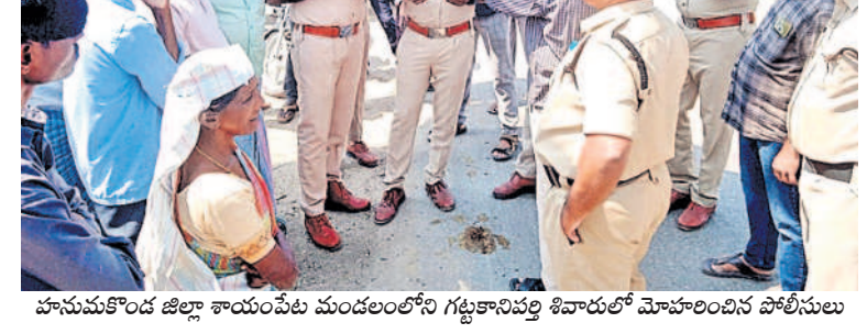
హనుమకొండ జిల్లా శాయంపేట మండలంలోని గట్టకానిపల్లి శివారులో మోహరించిన పోలీసులు