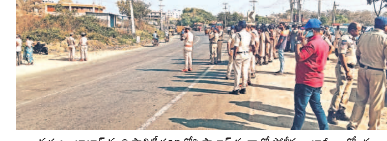
మానుకోటలో మున్సిపాలిటీ పరిధిలోని సొలార్ తండాలో పోలీసుల భారీ బందోబస్తు

మానుకోటలో నిరంధ సర్వే! మానుకోటలో నిరంధ సర్వే! మానుకోటలో నిరంధ సర్వే! మానుకోటలో నిరంధ సర్వే! మానుకోటలో నిరంధ సర్వే!