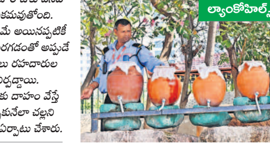
సగరంలో రోజు రోజుకు వేసవి తాపం అధికంవుతోంది. ఫిబ్రవరి మాసమే మొదటి వంద తాకిడి పెరగడంతో అప్పుడే చలి వేండ్రాలు రూపొందించాలి

లైన్ లో కాకుండా ప్రభుత్వ యంత్రాంగం పట్టణంలో ప్రభుత్వాన్ని నిర్వహించారు. బీసీ సంక్షేమ సంఘం గ్రేటర్ మహిళా విభాగం వర్కింగ్ ప్రెసిడెంట్ పెద్ది గారి సంగీతను వినిమిస్తూ, ఆర్.కృష్ణయ్య ఆరోపించారు. సోమలూరిలో ప్రెస్ క్లబ్ గురువారం ఏర్పాటు చేసిన మీడియా సమావేశంలో ఆయన మాట్లాడారు. రాష్ట్ర