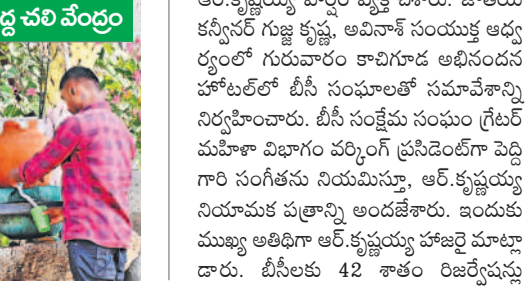
లాంకాకొవ్వల వద్ద చలి వేండ్రం