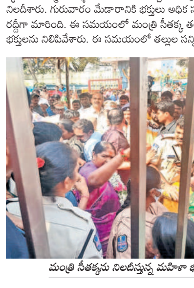
మంత్రి సీతక్కను నిలదీస్తున్న మహిళా భక్తులు