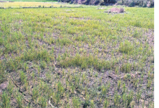
తుంగభద్ర మండలం బండ రామారంలో ఎండిపోయిన వరి