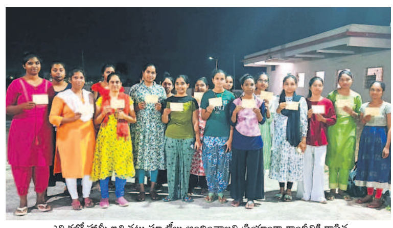
ఎన్నికల్లో హామీ ఇచ్చినట్లు స్కూల్ బాలుర అందించాలని ప్రియాంకా గాంధీనికి రాసిన ఉత్తరాలను చూపుతున్న నల్లగొండలోని ఎన్టీ పసపతి గృహం డిగ్రీ విద్యార్థినులు