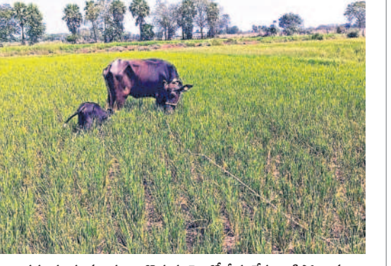
అడ్డగూడూరు మండలం బొడ్డుగూడెంలో నీళ్లు లేక ఎండిపోయిన వరి పొలంలో బర్రెను మేపుతున్న రైతులు