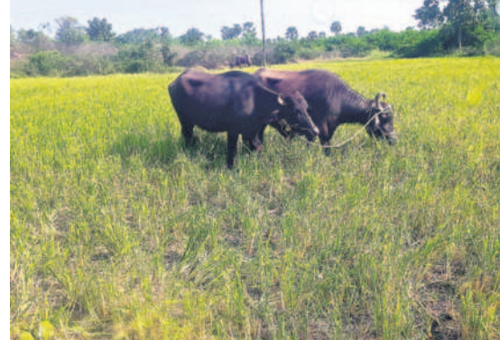
నూతనకల్ మండలంలో వరి పంటను మేపున్న బర్రెలు