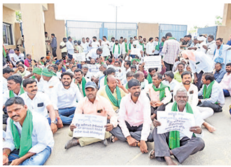
ఇటీవల మేడిపల్లి, కుర్తిపల్లి, నానకొనగర్, తాటిపల్లి గ్రామాల రైతుల కలెక్టరేట్ కు రాగా.. కలెక్టర్ అందుబాటులో లేకపోవడంతో అక్కడే ప్రధాన గేట్ ఎదుట బైటాయింది.. నిరసన తెలుపుతూ.. (ఫైల్)

ఇబ్రహీంపట్లం నియోజకవర్గంలో ఫార్మాసిటీ అనుబంధ గ్రామాలైన మేడిపల్లి, కుర్తిపల్లి, నానకొనగర్, తాటిపల్లి గ్రామాల్లో రైతుల పట్టా భూములను నిషేధిత జాబితాలో నుంచి తొలగించి వారి భూములు వారికి తిరిగి ఇప్పిస్తామని ఎన్నికలకు ముందు కాంగ్రెస్ నాయకులు హామీలిచ్చారు. దీంతో ఆయా గ్రామాల్లోని బాధిత రైతులంతా తమ ఓట్లను కాంగ్రెస్ అభ్యర్థికి వేశారు. అయితే ఆ పార్టీ అధికారంలోకి వచ్చి 14 నెలలు దాటితూ తమ భూములను నిషేధిత జాబితా నుంచి తొలగించలేదని.. తమకు రైతుభరోసాతోపాటు పొలాలపై బ్యాంకులకు రుణాలు ఇవ్వడంలేదని.. తమ భూములను అమ్ముకోవాలన్నా రిజిస్ట్రేషన్లు కావడంలేదని ఆ నాలుగు గ్రామాల రైతుల పార్టీ వ్యతిరేక పోరాట కమిటీని