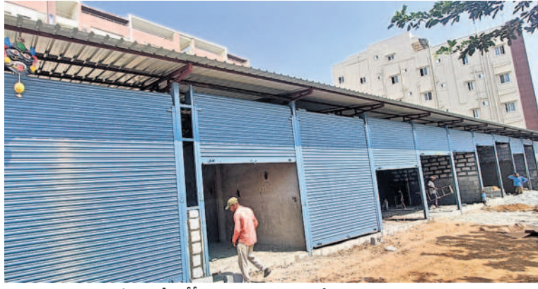
అదిబట్ల సమీపంలోని టీఆర్ఎస్ ఎదుట అనుమతులేకుండా నిర్మించిన షాపులు