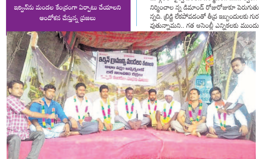
ఇర్లవంపల్లి మండల కేంద్రంగా ఏర్పాటు చేయాలని ఆందోళన చేస్తున్న ప్రజలు

• ఏటా పెరుగుతున్న మహిళా డ్రైవింగ్ లైసెన్సీలు • గతేడాది 43,774 లైసెన్సీలు జారీ సీటీబ్యూరో, ఫిబ్రవరి 13 (నమస్తే తెలంగాణ) : సగరంలో ఏటా డ్రైవింగ్ లైసెన్సీలు తీసుకుంటున్న మహిళల సంఖ్య పెరుగుతున్నది. అటు స్వయం ఉపాధిలోనూ ఇటు ఉద్యోగాల్లోనూ సగరంలో మహిళల సంఖ్య రోజురోజుకూ పెరుగుతుండడంతో అందుకు అనుగుణంగా ద్వితీయ, తృతీయ స్థాయి పాఠశాలను మగువల శాతం కూడా అదే స్థాయిలో ఉన్నది. కార్యాలయాలకు వెళ్లడం.. పిల్లలను స్కూళ్ల వద్ద దింపడం, పండుగలకు ఊరేగడం వంటి వనరుల సమయానుసారంగా చేసుకునేందుకు వీలుగా డ్రైవింగ్ నేర్చుకుంటున్నారు. దీంతో వీరి సంఖ్య కొంతకాలంగా క్రమంగా జోరందుకుతున్నది. గతేడాది 43,774 మంది మహిళలు లైసెన్సీలు పొందగా ఈ ఏడాది జనవరి నెల ముగిసేలోపే 1778 మంది మగువలు లైసెన్సీ పొందారు. . కారు లైసెన్సీల ఎక్కువ సగరంలో సుమారు 400లకు పైగా డ్రైవింగ్ స్కూళ్లు ఉన్నాయి. వీటితోపాటు మరో 50- 80 వరకు మార్కెట్, టయూటా లాంటి కంపెనీ డ్రైవింగ్ స్కూళ్లు అందుబాటులో ఉన్నాయి. ఇందులో ఒక్కో బ్యాచ్ కనీసం 20-35 మంది వొప్పున కారు నడపడం నేర్చుకుంటున్నారని నిర్వాహకులు చెబుతున్నారు. గ్రేటర్ పరిధిలో 2019 నుంచి ప్రస్తుతం వరకు సుమారు 2 లక్షలకు పైగా మంది మహిళలు డ్రైవింగ్ లైసెన్సీ పొందారు. ఇందులో అధిక భాగం కారు లైసెన్సీ ఉన్నవారే.