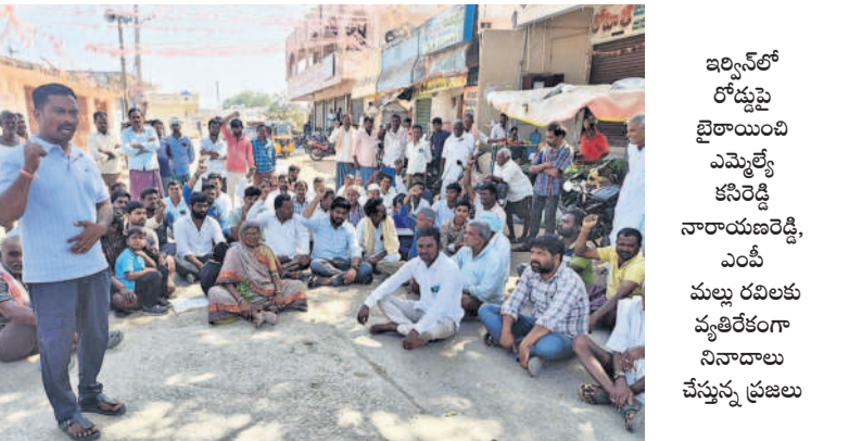
ఇర్లవంపల్లి రోడ్లపై బైటాయింది ఎమ్మెల్యే కనిరెడ్డి నారాయణరెడ్డి, ఎంపీ మల్ల రవిలకు వ్యతిరేకంగా నిరాదాన చేస్తున్న ప్రజలు