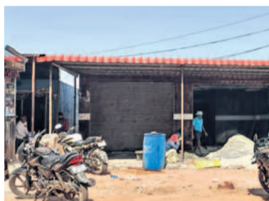
మంగోపల్లి గేటు సమీపంలో ఎలాంటి అనుమతులు లేకుండా నిర్మిస్తున్న రేకుల షాపు