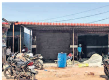
మంగోపల్లి గేటు సమీపంలో ఎలాంటి అనుమతులు లేకుండా నిర్మిస్తున్న రేకుల షాపు