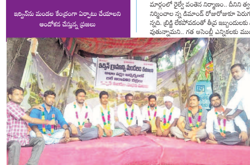
ఇర్లవోడ మండల కేంద్రంగా ఏర్పాటు చేయాలని ఆందోళన చేస్తున్న ప్రజలు

• ఏటా పెరుగుతున్న మహిళా డ్రైవింగ్ లైసెన్సీలు • గతేడాది 43,774 లైసెన్సీలు జారీ సీటీబ్యూరో, ఫిబ్రవరి 13 (నమస్తే తెలంగాణ) : సగరంలో ఏటా డ్రైవింగ్ లైసెన్సీలు తీసుకుంటున్న మహిళల సంఖ్య పెరుగుతున్నది. అటు స్వయం ఉపాధిలోనూ ఇటు ఉద్యోగాల్లోనూ సగరంలో మహిళల సంఖ్య రోజురోజుకూ పెరుగుతుండడంతో అందుకు అనుగుణంగా ద్వీచక్ర, కారు లైసెన్సీలు పొందుతున్న మగవల శాతం కూడా అదే స్థాయిలో ఉన్నది. కార్యాలయాలకు వెళ్లడం.. పిల్లలను స్కూళ్ల వద్ద దింపడం, పండుగలకు ఊరేగడం వంటి పనులు సమయానుసారంగా చేసుకునేందుకు వీలుగా డ్రైవింగ్ నేర్చుకుంటున్నారు. దీంతో వీరి సంఖ్య కొంతకాలంగా క్రమంగా జోరందుకుతున్నది. గతేడాది 43,774 మంది మహిళలు లైసెన్సీలు పొందగా ఈ ఏడాది జనవరి నెల ముగిసేలోపే 1778 మంది మగవల లైసెన్సీ పొందారు. . కారు లైసెన్సీల ఎక్కువ సగరంలో సుమారు 400లకు పైగా డ్రైవింగ్ స్కూళ్లు ఉన్నాయి. వీటితోపాటు మరో 50- 80 వరకు మార్కెట్, టయూటా లాంటి కంపెనీ డ్రైవింగ్ స్కూళ్లు అందుబాటులో ఉన్నాయి. ఇందులో ఒక్కో బ్యాచ్ కు 20-35 మంది వొప్పున కారు నడపడం నేర్చుకుంటున్నారని నిర్వాహకులు చెబుతున్నారు. గ్రేటర్ పరిధిలో 2019 నుంచి ప్రస్తుతం వరకు సుమారు 2 లక్షలకు పైగా మంది మహిళలు డ్రైవింగ్ లైసెన్సీ పొందారు. ఇందులో అధిక భాగం కారు లైసెన్సీ ఉన్నవారే.