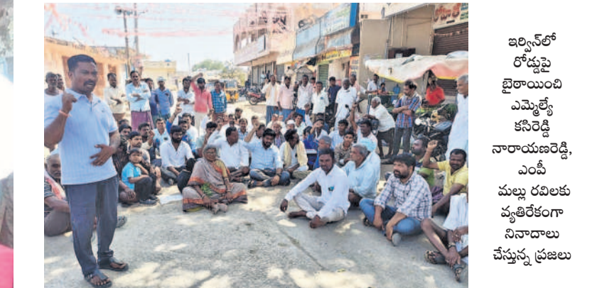
ఇర్లవోడలో రోడ్లపై బైటాయింది ఎమ్మెల్యే కనిరెడ్డి నారాయణరెడ్డి, ఎంపీ మల్ల రవిలకు వ్యతిరేకంగా నిరాదాన చర్యలు ప్రజలు