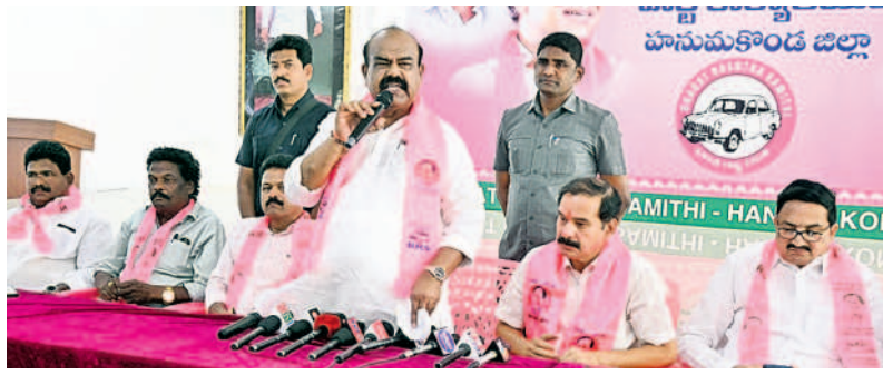
సమావేశంలో మాట్లాడుతున్న సీనియర్ మధ్యస్థుల నాయకులు