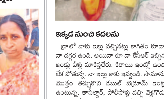
- గంటి నిర్మల, పాపగల్

కేసీఆర్ ప్రభుత్వం ఇండ్లు లేని వారి కోసం డబుల్ బెడ్రూమ్ నిర్మించి డ్రా పద్ధతినే మాకు కేటాయింది. కానీ కాంగ్రెస్ ప్రభుత్వం తమకు ఇల్లు ఇవ్వకుండా వేరేవారికి ఇవ్వడానికి చూస్తుంది. అదే ఇరిగితే తాము డబుల్ బెడ్రూమ్ ఇండ్ల పట్టి అక్కడక్కడ వేసుకోవడానికి కూడా వెనుకాడం. అధికారులను ఎన్నిసార్లు అడిగినా సరైన సమాధానం చెప్పడం లేదు. ఈరోజు ఇండ్ల పద్దకు వచ్చి ఉన్నాం. కానీ తానీలార్, పోలీసులు మమ్మల్ని వెళ్లగొట్టారు.