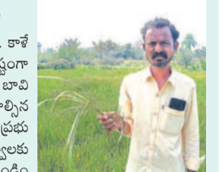
పెన్హడల్ మండలంలోని నూర్లహన్ పేట, జల్లుకుంటపండా, చిన్న సీతలపండా తండాలో ఎండిపోతున్నాయి.

నాకున్న ఇదికరాలలో వరి నాటు పెట్టాను. కాశీశ్వరం నీళ్లు రాకపోవడంతో సాగు కష్టంగా మారింది. ఎండలు ముడదండంతో బోర్లు, బావుల్లోనూ నీళ్లు అడుగంటాయి. చేతికి రావాల్సిన పంట పూర్తిగా ఎండిపోయింది. బీఆర్ఎస్ ప్రభుత్వంలో కాశీశ్వరం నీళ్లు ఎన్నారెన్నో కాలంగా వదులు చేయడంతో రెండు పంటలు పండించాను. ఇప్పుడు పరిస్థితి మారాలి అంటుంది. ప్రభుత్వమే ఆదుకోవాలి.