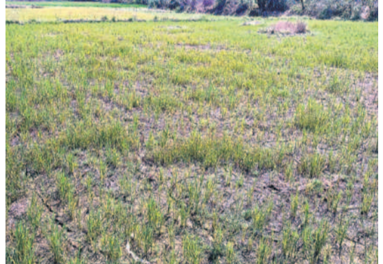
తుంగభద్ర మండలం బండ రామారంలో ఎండిపోయిన వరి