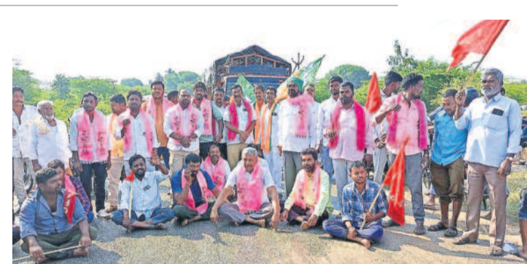
కొలుసుపాక వాగుపై హైలెవెల్ బ్రిడ్జి నిర్మించాలి