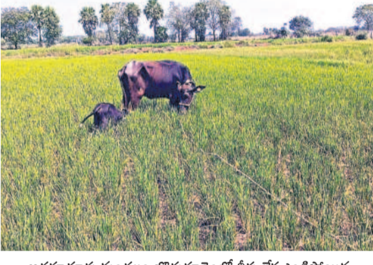
అడ్డగూడూరు మండలం బొడ్డుగూడెంలో నీళ్లు లేక ఎండిపోయిన వరి పొలంలో బలైలు మేపుతున్న రైతులు