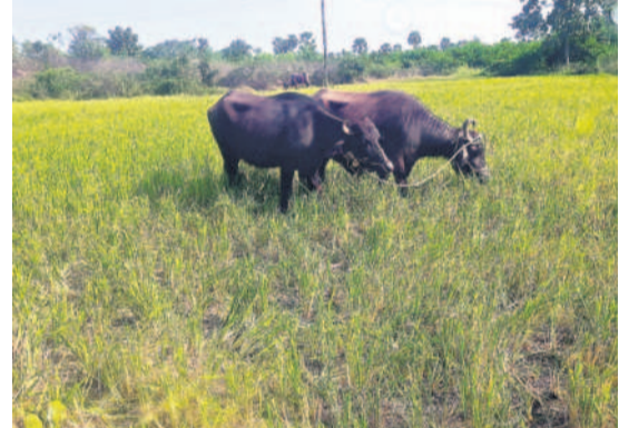
నూతనకల్ మండలంలో వరి పంటను మేపుతున్న బలైలు