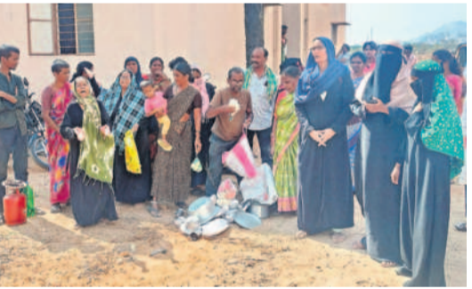
డబుల్ బెడ్రూమ్ ఇండ్ల పట్టణం వేస్తున్న లబ్ధిదారులు

నల్లగొండ సీట్, ఫిబ్రవరి 13 : పేదల సొంతింటి కలను నెరవేర్చేందుకు గత బీఆర్ఎస్ ప్రభుత్వం నల్లగొండ పట్టణంలో నిర్మించిన డబుల్ బెడ్రూమ్ ఇండ్లను లక్ష్మి డ్రా ద్వారా ఎంపిక చేసిన వారికి అప్పగించాలని లబ్ధిదారులు గురువారం ఆందోళనకు దిగారు. కొంత సామగ్రితో వచ్చి ఇండ్ల ఎదుట బయటించారు. కొద్దిమంది సామగ్రితో వెళ్తున్నారు. ఈ సందర్భంగా అభిదారులు మాట్లాడుతూ గత కేసీఆర్ ప్రభుత్వం పేదల కోసం కట్టిన సమీపంలో 2017లో ఇండ్ల నిర్మాణం ప్రారంభించి 2023లో పూర్తి చేసినందుకు 530 ఇండ్ల నిర్మాణం ఎన్నికల ద్వారా 421 మందిని ఎంపిక చేసినట్లు తెలిపారు. ఎన్నికల