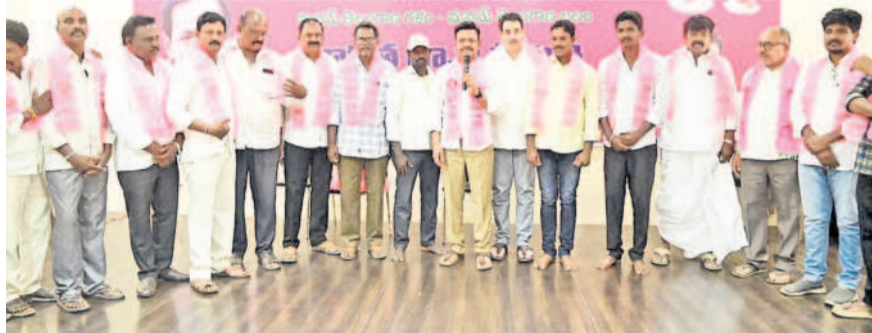
కాంగ్రెస్ నుంచి బీఆర్ఎస్లో చేరిన వారికి గులాబీ కండువలు కప్పిన అనంతరం మాట్లాడుతున్న తాతా మధు