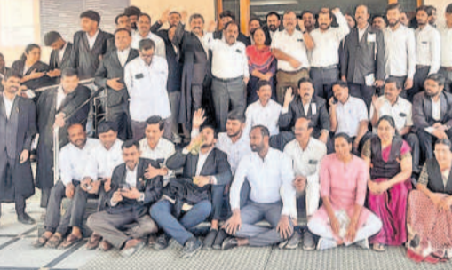
న్యాయమూర్తిపై దాడి నేపథ్యంలో కూకట్‌పల్లి కోర్టులో నిరసన తెలుపుతున్న న్యాయవాదులు