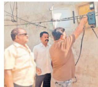
కనెక్షన్ తొలగిస్తున్న కొంపల్లి మున్సిపాలిటీ విద్యుత్ విభాగం సిబ్బంది గింపాలని విద్యుత్తు సబంధిత ఆడిట్ జారీ చేయడంతో విద్యుత్ సరఫరాను నిలిపివేశారు. మున్సిపాలిటీ అజినా నుంచి కరెంటు బిల్లులు చెల్లించుట నివేదికలు తయారు చేయాలని కిందిస్తాయి అధికారులకు సూచించారు. మున్సిపాలిటీలో ఇలాంటి వాటిని గుర్తించాలని, పూర్తిగా నిలువ చెల్లించుట పక్కనాడిగా చర్యలు తీసుకోవాలని అధికారులకు సూచించారు.