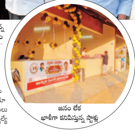
జనం లేక ఖాళీగా కనిపిస్తున్న స్థాళను

మున్సిపాలిటీ నుంచి కార్పొరేషన్ గా మార్చడంతో మహా సగర్వేత్తల కార్యక్రమం మధ్యాహ్నం 2:30 గంటలకు అట్రాక్షన్ గా ప్రారంభించాలని నిర్ణయించినా ప్రజలు రాకపోవడంతో సాయంత్రం 4:30 గంటలకు పొడిగించారు. అప్పటికి ఎవరూ కనబడకపోవడంతో అధికారులు, ప్రజాప్రతినిధులు నిరాశకు గురయ్యారు. అనంతరం కలెక్టర్, ఎమ్మెల్యే 5 గంటలకు కార్యక్రమాన్ని ప్రారంభించారు.