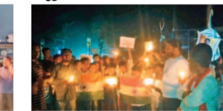
ఉటూరు : నివాళులర్పిస్తున్న విద్యార్థులు