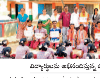
విద్యార్థులను అభినందిస్తున్న ఉపాధ్యాయులు