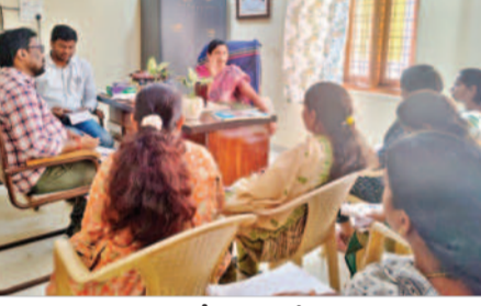
మాట్లాడుతున్న డీఎంహెచ్వో సౌభాగ్య లక్ష్మి

ప్రాథమిక ఆరోగ్య కేంద్రాలలో ప్రసవాల సంఖ్య పెంచాలని డీఎంహెచ్వో సౌభాగ్య లక్ష్మి సూచించారు. శుక్రవారం పట్టణంలోని డీఎంహెచ్వో కార్యాలయంలో పీహెచ్సీల వైద్యాధికారులతో సమీక్ష సమావేశం నిర్వహించి మాట్లాడారు. ఏఎన్ఎంలు నిర్ణయించిన ఏఎన్సీ రిజిస్ట్రేషన్లను పంపిణీ చేయాలన్నారు. ప్రతి పీహెచ్సీలో క్యాన్సర్ రోగులకు సంబంధించి ఓపీ చూసే సమయంలో ఓఆర్ క్యాన్సర్ రోగులను గుర్తించాలన్నారు. పీహెచ్సీ పీహెచ్సీ సాయంగా మాట్లాడుతూ ఆరోగ్య శిబ్దాలకు వేసే ప్రతి బీతాను ఆన్ లైన్లో పొందుపర్చాలన్నారు. పీహెచ్సీలలో చూసే ఓపీలో 15 శాతం రోగులు