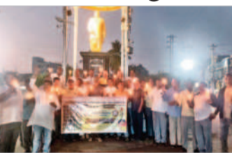
మహబూబ్ నగర్ : నివాళులర్పిస్తున్న మాజీ సైనికులు