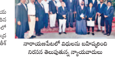
నారాయణపేటలో విధులను బహిష్కరించి నిరసన తెలుపుతున్న న్యాయవాదులు