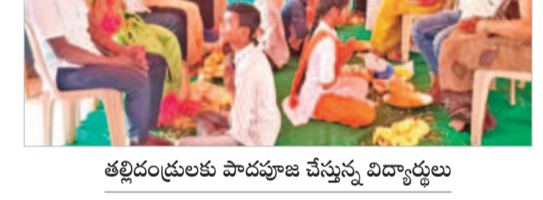
తల్లిదండ్రులకు పాదపూజ చేస్తున్న విద్యార్థులు