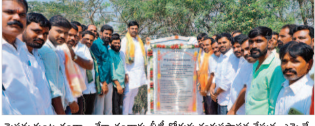
మొసమ్యకుండు తండా - కేశవారావు బీటీ రోడ్డుకు శంకుస్థాపన చేస్తున్న ఎమ్మెల్యే