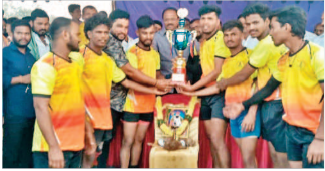
క్రీడాకారులకు బహుమతులు అందజేస్తున్న లక్ష్మారెడ్డి

● మాజీ మంత్రి లక్ష్మారెడ్డి బాలానగర్, ఫిబ్రవరి 14 : క్రీడలతో మానసికోల్లాసం, స్నేహపూర్వక వాతావరణం నెలకొంటుంది మాజీ మంత్రి లక్ష్మారెడ్డి అన్నారు. బాలానగర్ మండలం, ఈడారెడ్డి ప్రకాశ్, శివానందరెడ్డి, మల్లేశ్, ఈడారెడ్డి తండ్రి లో నిర్వహించిన కబడ్డీ