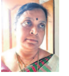
క్షేత్రస్థాయిలో పరిశీలించి మంజూరు చేస్తాం