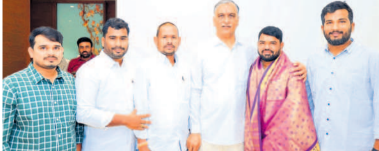
మాజీ మంత్రి హరీశ్ రావుతో బీఆర్ఎస్ మండల నాయకులు