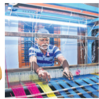
అనుబంధ కార్మికుల కుదింపు

నేతన్నలను గత బీఆర్ఎస్ ప్రభుత్వం అన్ని విధాలుగా అడుకుంటూ అండగా నిలిచింది. బతుకుదరువు కోసం వలసలు వెళ్ళిన కార్మికులు తిరిగి సగ్గలామాలకు వచ్చి ఉపాధి పొందేలా చేయాలనేది. నేతన్నల సామాజిక భద్రత కోసం అప్పటి ముఖ్యమంత్రి కేసీఆర్ చేనేత పాదుపు పథకానికి శ్రీకారం చుట్టారు. 2017, 2021లో విజయవంతంగా పథకం కొనసాగించారు. నేతన్నలకు ఆర్థికంగా ఎంతో ఆసరాగా నిలిచింది. దీని ద్వారా ప్రభుత్వం నిలకు రూ. 400 వరకు చెల్లించే పాదుపులో 11వేల మంది కార్మికులు చేనేత పాదుపులో నమోదు చేసుకున్నారు. వారందరికీ సీమీ వ్యవధి ముగిసా ఒక్కొక్క కుటుంబానికి రూ. 2 లక్షల వరకు సాయం అందింది.