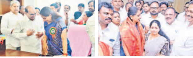
ఎమ్మెల్సీ కవితను మర్యాదపూర్వకంగా కలిసిన మాజీ ఎమ్మెల్యే 'మెచ్చా'