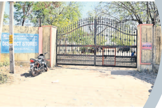
మంచెర్లాలలోని విద్యుత్ శాఖ జిల్లా స్టోర్స్

గగా తనకు రావాల్సిన సామగ్రి స్టోర్ లో ఉందని చెప్పడంతో విషయం వెలుగులోకి వచ్చింది. 20 కిలో మీటర్ల 32 కేబిల్స్ కరెంట్ తీగ విలువ సుమారుగా రూ. 15 లక్షల వరకు ఉంటుందని అధికారులు చెబుతున్నారు. గందరగోళంగా మారిన ఈ అంశంపై ఇన్స్పెక్టర్ నెలలు గడుస్తున్నా పురోగతి కనిపించకపోవడంతో అసమానం వచ్చిన అధికారులు ఈ మేరకు విచారణ జరిపారు. దీంతో భాగంగానే సంబంధిత కాంట్రాక్టరును వారు అడ