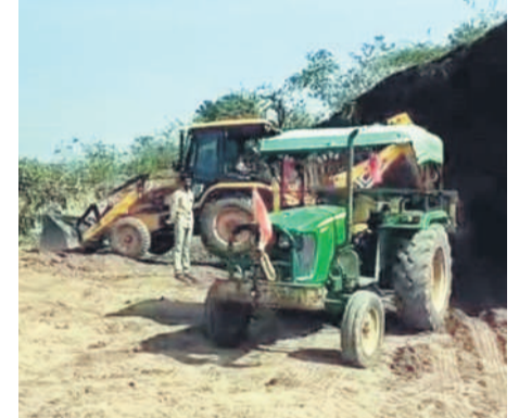
మట్టి మాఫియా దాదాగిరి..

కుటుంబ ఆసిఫాబాద్, ఫిబ్రవరి 15 (నమస్తే తెలంగాణ) : కుటుంబ ఆసిఫాబాద్ జిల్లాలో మట్టిమాఫియా బరితెగింది. రాత్రి రాత్రే గుట్టలను మాయం చేస్తున్నది. అధికారుల అందడంపై రాత్రి.. పగలా ఆనే తేడా లేకుండా జేసీబీలతో ఇన్స్టానుసారంగా మట్టిని తరలిస్తున్నది. కళ్ల ముందే జోరుగా దండా సాగిస్తున్నా అధికారులు 'మామూలు'గా తీసుకోవడం విమర్శలకు తావిస్తున్నది.