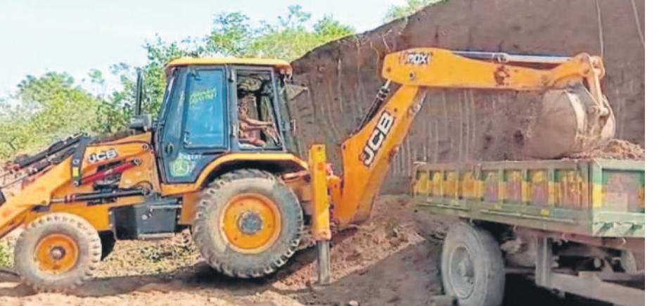
ఆసిఫాబాద్ సమీపంలోని గుట్టలను తవ్వుతున్న జేసీబీ

మట్టిని తరలిస్తూ లక్షలు దండుకుంటున్నారు. రోజుల తరబడి మట్టిని తోడుకొట్టడం వల్ల గుట్టలు కనుమరుగై మైదానాలుగా మారుతున్నాయి. ఈ విషయంపై ప్రశ్నిస్తున్న స్థానికులపై మట్టి మాఫియా దాదాగిరి చేసి బెదిరింపులు పొల్పడంపై మట్టి తవ్వకం ఆసిఫాబాద్ జిల్లా కేంద్రానికి దగ్గరలోని చిరకుంట్లకు వెళ్లడానికి ఉన్న పాపమ్మ ఆలయం సమీపంలోని గుట్టల వద్ద ఏకంగా జేసీబీలను పెట్టి నిత్యం చదుల సంఖ్యలో ట్రాక్టర్ల