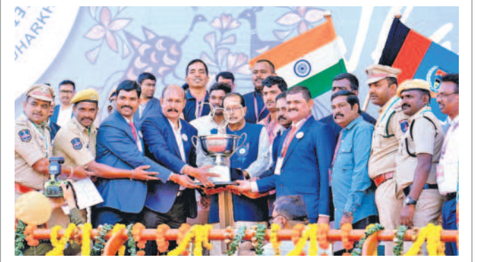
ఓవరాల్ టీం చాంపియన్ షిప్ ట్రోఫీని అందుకుంటున్న తెలంగాణ పోలీసులు