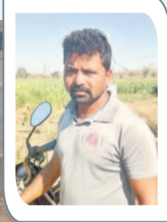
మోటార్ సెటిల్మెంట్ నీటి క్యాంప్ను సాలేగూడకు తీసుకెళ్తా..