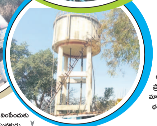
అలంకర ప్రాయంగా భరించిన భారతదేశ నీటి ట్యాంక్

సాలేగూడ ఆదివాసులను పీడిస్తున్న నీటి కష్టాలు ఇంటింటికీ ఎడ్లబండ్లపై ట్యాంకులు