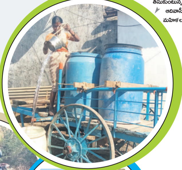
ట్యాంకుల్లోని నీటిని తీసుకుంటున్న ఆదివాస మహిళల