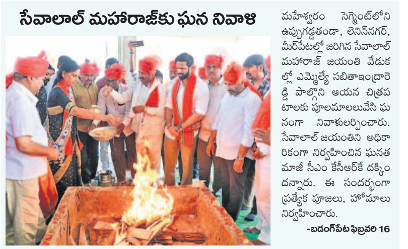
సేవాలాల్ మహారాజ్ కు ఘన నివాళి