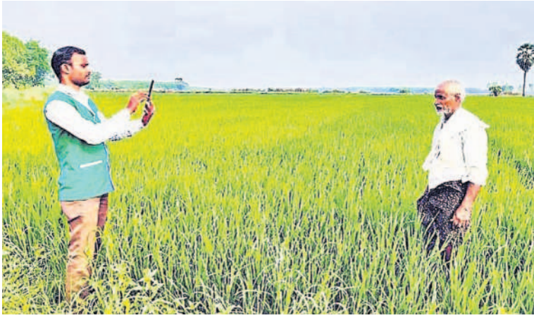
సర్వేలో భాగంగా రైతు, పంట ఫోటోను యాప్లో అప్లోడ్ చేస్తున్న ఏఈవో