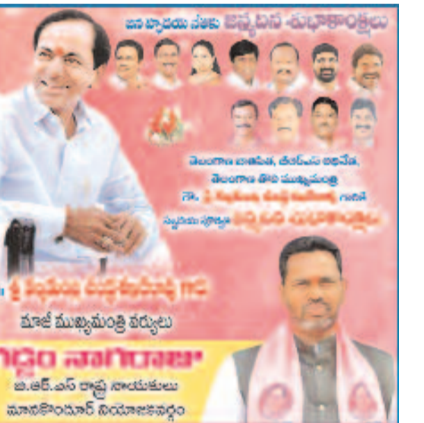
మాజీ ముఖ్యమంత్రి కేసీఆర్