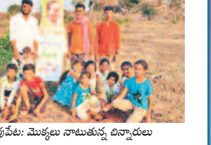
గంధీవ్రావేటి: మొక్కలు నాటుతున్న విద్యార్థులు