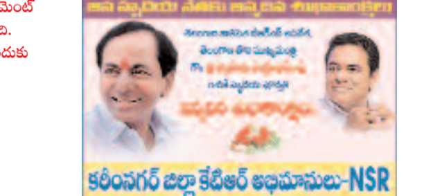
కరీంనగర్ జిల్లా కేసీఆర్ అభిమానులు-NSR