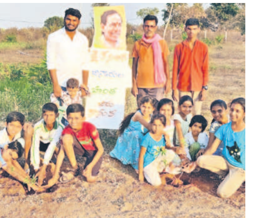
గంధీరావుపేట: మొక్కలు నాటుతున్న బిన్నారలు