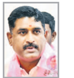
వేడుకలు ఘనంగా నిర్వహిస్తాం

తెలంగాణ తొలి సీఎం కేసీఆర్ జన్మదినం సందర్భంగా వ్యక్తమైన చేస్తున్నాం. ప్రతి బీఆర్ఎస్ కార్యకర్త, నాయకులు మూడు చొప్పున మొక్కలు నాటి అధినేతకు కానుకగా ఇస్తున్నాం. కార్యకర్తలకు కాకుండా వారి కుటుంబ సభ్యులు కూడా ఈ కార్యక్రమంలో పాల్గొంటున్నారు. ఎమ్మెల్యేలు, మాజీ ఎమ్మెల్యేల నేతృత్వంలో కేసీఆర్ జన్మదిన వేడుకలు ఘనంగా నిర్వహిస్తాం. ప్రతి మండల కేంద్రం, గ్రామాల్లో కేకే కేకే చేస్తున్నాం. రక్తదాన శిబిరాలు, ఆస్తుదాన కార్యక్రమాలు చేపడుతున్నాం. ఆయాలో ప్రత్యేక అర్చనలు చేస్తున్నాం. ప్రతి కార్యకర్త కేసీఆర్ జన్మదిన వేడుకల్లో పాల్గొనాలి. ఎమ్మెల్యే ఎన్నికల కోడె ఉన్నదని మెనుకడకు వేయవద్దు. ఇది దాని పరిధిలోకి రాదు. వేడుకలు జిల్లాలో గొప్పగా జరిపేందుకు కార్యచరణ చేసుకున్నాం.