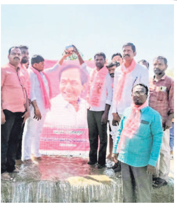
ముస్తాబాద్: మధ్యకంటు చెరువు వద్ద కేసీఆర్ బిల్దించుకుని పాఠాభిషేకం చేస్తున్న కేసీఆర్ సేన రాష్ట్ర నాయకులు

ఉద్యమనేత, ప్రగతి ప్రదాత, తెలంగాణ తొలి ముఖ్యమంత్రి కేసీఆర్ కు కరీంనగర్ జిల్లా అంటే ప్రత్యేకమైన అభిమానం! ఎవరినీ అనుబంధం! అప్పటి తెలంగాణ రాష్ట్ర సమితిని ప్రారంభించిన తర్వాత ఈ గడ్డ మీదనే ప్రత్యేక రాష్ట్ర పోరాటానికి శ్రీకారం చుట్టారు. ఉద్యమం పతాక స్థాపించే చేరుకున్న తర్వాత ఆమరణ నిరాహార దీక్షకు పూనుకున్న కేసీఆర్ ను, అల్లునూరిలోనే అరెస్ట్ చేసినా, ఆ తర్వాత వెనక్కి తగ్గకుండా పోరాటం చేశారు. కరీంనగర్ ఎంపీగా ఒకసారి జనరల్ ఎన్నికల్లో, రెండు సార్లు ఉప ఎన్నికల్లో ఇక్కడి నుంచే విజయం సాధించి చరిత్ర సృష్టించారు. ఇలా కరీంనగర్ జిల్లా ఉద్యమ చరిత్రలో తన పేరును సువర్ణకాలంతో బిల్దించుకున్న ఆయన, ప్రత్యేక రాష్ట్రంలో అధికారంలోకి వచ్చిన తర్వాత తొలి ముఖ్యమంత్రిగా కీలక పథకాలను ఈ ప్రాంతంలోనే ప్రారంభించారు. సత్సేన పుర్రా నడిపించారు. అందుకే కరీంనగర్ అంటే కేసీఆర్ సెంటిమెంట్ జిల్లాగా నిలిచిపోయింది. అన్నివిధాలా కలిసివచ్చింది. సోమవారం కేసీఆర్ బర్తదేను పండుగలా నిర్వహించేందుకు ఉమ్మడి జిల్లా సిద్ధమైంది.