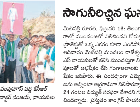
రాజేశ్వరరావుపేట పంపుచానో వద్ద కేసీఆర్ బిల్దించుకున్న మొక్కలను బిన్నారలు