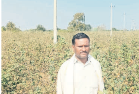
తన చేనులోని విద్యుత్ లేనందుకు బిచ్చంపై రైతు

● బోర్డు వేసి మోటార్లు, విద్యుత్ సౌకర్యం కల్పించని అధికారులు ● ఏళ్ల తరబడి నిరీక్షిస్తున్న గిరిజన రైతులు