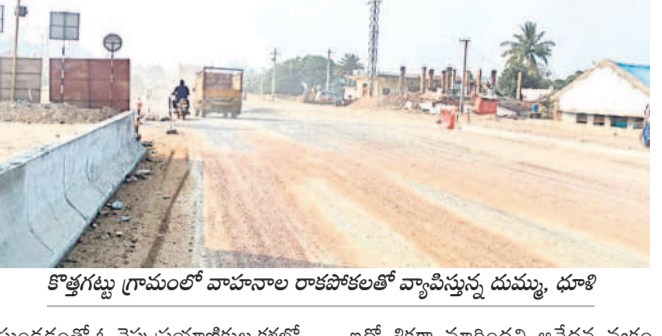
కొత్తగట్టు గ్రామంలో వాహనాల రాకపోకలతో వ్యాపిస్తున్న దుమ్ము, ఢూళి

శంకరపట్నం, ఫిబ్రవరి 16: జాతీయ రహదారి ఎన్హెచ్-583 నిర్మాణ సంస్థ నిర్మాణకులు నిర్లక్ష్యంతో ప్రయాణికులు, రోడ్డు పక్కన ఉన్న ఇండ్లలో నివసించే వారు దుమ్ము-ఢూళితో సతమతమవుతున్నారు. కొత్తగట్టు నుంచి తాడికల్ వరకు నిర్లక్ష్యం నాలుగు రోజు జాతీయ రహదారి నిర్మాణ పనులు ముమ్మరంగా కొనసాగుతుండగా, కొత్తగట్టు, మెలలగూర్, కేశవపట్నం, తాడికల్ శివార్లలో రోడ్డు పక్కనుంచి వాహనాల రాకపోకల వల్ల దుమ్ము లేచి ఇండ్లలో నివసించే వారితో పాటు ప్రయాణికులు అనేక అవస్థలు పడుతున్నారు. రోడ్డు నిర్మాణ సంస్థ నిర్మాణకులు రోడ్డు పనుల సందర్భంగా దుమ్ము-ఢూళి వ్యాపకంకూడా సీటిని చల్లచేస్తూనే ఉండగా, సిబ్బంది నిర్లక్ష్యంగా వ్యవహరిస్తుండడంతో ఓ వైపు ప్రయాణికుల కళ్లలో పడడంతోపాటు, శరీరం దుమ్ము కొట్టుకుపోతుండగా, మరోవైపు రోడ్డు పక్కన ఉన్న ఇండ్లలో దుమ్ము ఢూళి వ్యాపించి రోగలబారిన పడుతున్నట్లు పలువురు కొత్తగట్టు వాసులు వాపోతున్నారు. నిత్యం తమకు