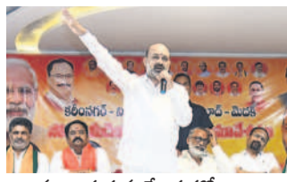
మాట్లాడుతున్న కేంద్ర హోం శాఖ సహాయ మంత్రి బండి సంజయ్

విద్యాసంగ, ఫిబ్రవరి 16: టీవర్షి, గ్రాడ్యుయేట్ ఎమ్మెల్యే ఎన్నికల్లో పోటీ చేయడానికి కాంగ్రెస్ పార్టీకి అర్హత లేదని కేంద్ర హోంశాఖ సహాయ మంత్రి బండి సంజయ్ కుమార్ విమర్శించారు. 'టీవర్షి, గ్రాడ్యుయేట్ పక్షాన ఎన్నడైనా పోరాటాలు చేశారా? 317 జిహోకు వ్యతిరేకంగా ఎన్నికల పక్షాన ఎన్నడైనా ప్రజలు వెళ్లారా? మరి కాంగ్రెస్ అభ్యర్థులకు ఎందుకు ఓట్లయ్యాయి?' అని ప్రశ్నించారు. 'టీవర్షి, నిరుద్యోగ సమస్యపై నిరంతరం కొట్లాడింది. జైలుకు వెళ్లింది, లాఠీదెబ్బలు తిన్న చరిత్ర బీజేపీదే...' అని సస్పెన్డ్ చేశారు. నగరంలో ఆదివారం కలింగనగర్, నిజామాబాద్, ఆదిరాబాద్, మెదక్ ఎమ్మెల్యే నియోజకవర్గాల్లో పోటీ పడిన కార్యకర్తల సమావేశంలో బండి టీజే టీ... అని సస్పెన్డ్ చేశారు. నగరంలో ఆదివారం కలింగనగర్, నిజామాబాద్, ఆదిరాబాద్, మెదక్ ఎమ్మెల్యే నియోజకవర్గాల్లో పోటీ పడిన కార్యకర్తల సమావేశంలో బండి టీజే టీ... అని సస్పెన్డ్ చేశారు. నగరంలో ఆదివారం కలింగనగర్, నిజామాబాద్, ఆదిరాబాద్, మెదక్ ఎమ్మెల్యే నియోజకవర్గా