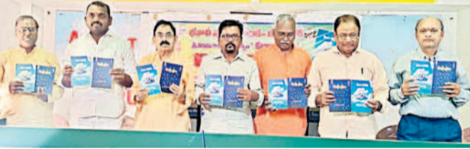
పుస్తకాన్ని అభివృద్ధిస్తున్న కవులు

కలెక్టర్ పమేలా సత్యతి వారు నేరుగా ప్రజాపాలన సేవాకేంద్రాల్లో సంప్రదించి, వివరాలు సిబ్బందికి అందజేస్తే సమగ్ర చేస్తారని తెలిపారు. ఆన్లైన్లో కూడా సర్వే ఫారం డౌన్లోడ్ చేసుకుని, వివరాలు నింపి ఆ ఫారాన్ని ప్రజాపాలన సేవా కేంద్రాల్లో అందజేయవచ్చునన్నారు. http://seecpsurvey.cg.gov.in వెబ్సైట్లో లాగిన్ అయిన సర్వే ఫారాన్ని డౌన్లోడ్ చేసుకుని ప్రత్యేక కార్యకర్తలను నిర్ణయించి తెలిపారు. 040-2111111 నంబర్లో ఉదయం 9 నుంచి సాయంత్రం 5 గంటల వరకు తమ వివరాలు తెలియజేసుకోవచ్చు. ఇంతకుముందు సర్వేలో పాల్గొనని