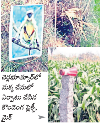
చెర్రభూత్కూర్ లో మళ్ళీ వేసుకోవడానికి కొండెం ఫ్లెక్స్, మైక్స్