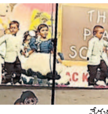
వేడుకల్లో స్వత్యం చేస్తున్న చిన్నారులు