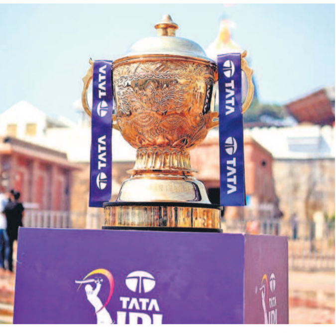
హైదరాబాద్లో నాకౌట్ మ్యాచ్లు

వేసవిలో క్రికెట్ మజాను అందించడానికి ప్రపంచంలోనే అతిపెద్ద క్రికెట్ లీగ్ సిద్ధమైంది. ఐపీఎల్ 18వ సీజన్ షెడ్యూల్ వచ్చేసినది. దేశంలోని 13 నగరాలలో ఏకంగా 65 రోజుల పాటు సుదీర్ఘంగా జరిగే ఈ క్రికెట్ పండుగ మార్చి 22న తెరవనుంది. అంతర్జాతీయ క్రికెట్ స్టాండ్ కలిసి దేశవ్యాప్త యువ సంచలనాలు మెరుపులు మెలపించబోయే ఈ క్యాన్సెల్ రన్ కేమెంట్లో తొలి మ్యాచ్ కేకేఆర్, ఆర్సీబీ మధ్య జరుగుతుంది. ఈసారి హైదరాబాద్కు 'డబుల్ బొనాంజా. లీగ్ మ్యాచ్లతో పాటు నాకౌట్ మ్యాచ్లకూ ఉత్సాహ స్టేడియం అతిథ్యమివ్వనుండటం గమనార్హం.