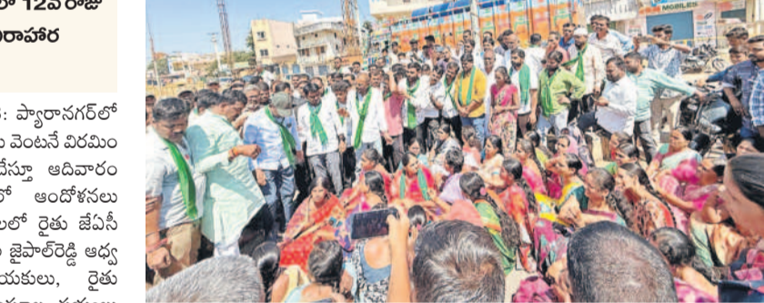
డంపింగ్ యార్డు అనుమతులు రద్దు చేయాలంటూ గుమ్మడిదలలోని హైవేపై మహిళలతో కలిసి ఆందోళన చేస్తున్న నర్సాపూర్ ఎమ్మెల్యే సునీతారెడ్డి

ప్యారానగర్ లో డంపింగ్ యార్డును వ్యతిరేకిస్తూ ఉధృతమవుతున్న ఆందోళనలు