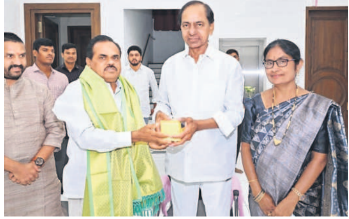
బీఆర్ఎస్ అధినేత కేసీఆర్ తో ముస్లింల దంపతులు