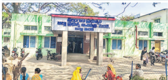
మెడక్ లోని జిల్లా కేంద్ర దవాఖానా

ఐసీయూ, బ్లడ్ బ్యాంక్ ఉద్యోగులకు అందని వేతనాలు