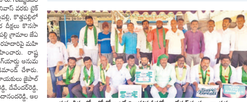
గుమ్మడిదలలో ఆరోజు రిలే నిరాహార దీక్షలో అంబేద్కర్ సంఘం నాయకులు