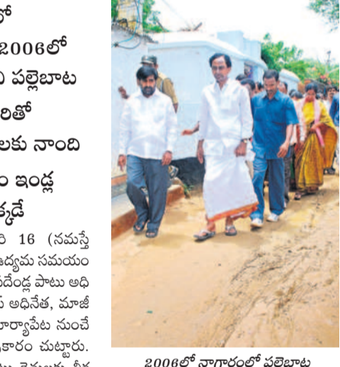
2006లో నాగారంలో పల్లెటూరు సందర్భంగా పత్తాభిషేకం చేసిన కేసీఆర్, పత్తాభిషేకం (వైపి)

• 2002లో సాగర్ జలాల కోసం కోదాడలో పాదయాత్ర... 2006లో నాగారం నుంచి పల్లెటూరు • 2012 సమరభేరితో సంక్షేమ పథకాలకు నాంది • డబుల్ బెండ్రం ఇండ్ల శంకుస్థాపన ఇక్కడ సూర్యాపేట, ఫిబ్రవరి 16 (నమస్తే తెలంగాణ) : తెలంగాణ ఉద్యమ సమయం లోనైనా... తదనంతరం వందేళ్ల పాటు అధికారంలో ఉన్నా బీఆర్ఎస్ అధినేత, మాజీ ముఖ్యమంత్రి కేసీఆర్ సూర్యాపేట నుంచే పలు కార్యక్రమాలకు శ్రీకారం చుట్టారు. నాగార్జునసాగర్ ఆయకట్టు రైతులకు సీక్ర కోసం 2002లో కోదాడ నుంచి నాగార్జున సాగర్ వరకు పాదయాత్ర చేపట్టారు. అలాగే తెలంగాణ ఉద్యమాన్ని అణగదొక్కాలనే కుట్రలను తెరవేసి బీఆర్ఎస్ నుంచి గెలుపొందిన ఎమ్మెల్యేలను లాక్కన్లు నాటి ముఖ్యమంత్రి వై.ఎస్.రాజశేఖరరెడ్డి తెలంగాణ ప్రజల్లో ప్రత్యేక రాష్ట్ర కోరిక లేదని అందిం దగా 2006లో పల్లెటూరు కార్యక్రమాన్ని కేసీఆర్ చేపట్టారు. అది ఉద్యమం నాటి నుంచి