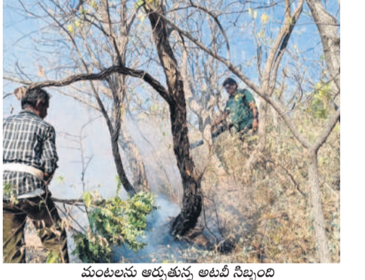
మంటలను అదుపు చేసే నిబంధన

తిరుమలగిరి(సాగర్), ఫిబ్రవరి 16 : మండలంలోని మూలతండా వద్ద గల నాగార్జున సాగర్ రిజర్వ్ ఫారెస్ట్ లో ఆదివారం మంటలు వెల రోగాయి. సుమారు 15 ఎకరాల్లో అటవీ ప్రాంతం దగ్గరైంది. మూల తండా అటవీ ప్రాంతంలో మంటలు వ్యాపించాయని స్థానికులు తెలుపడంతో ఫారెస్ట్ అధికారులు వెంటనే అక్కడికి చేరుకోని మంటలను అదుపులోకి తెచ్చారు. అప్పటికే సుమారు 15 ఎకరాల్లో చెట్లు పోయినట్లు దగ్గరయ్యాయని అధికారులు తెలిపారు.