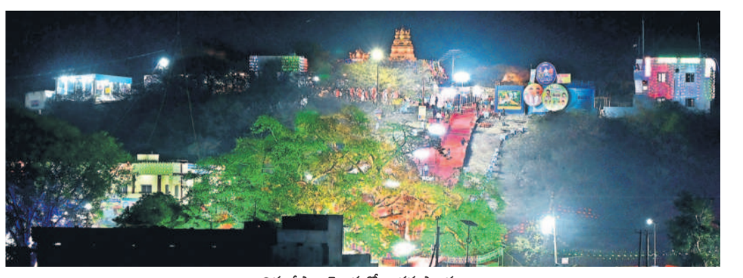
విద్యుద్దీపాల వెలుగులో జాతర ప్రాంగణం

• చరిత్రలో నిలిచేలా యాదగిరి గుట్ట ఆలయ పునర్నిర్మాణం యాదగిరిగుట్ట : కలెక్టర్ తపస్సు చేసిన నారసింహ స్వామి వారిని కొండపైకి తీసుకు వచ్చిన యాద మహర్షి ఆయన.. ఆ స్వామివారి కొండను వెయ్యేండ్లు చెక్కు చెదరకుండా ఎంతో ఆయత్నంగా పునర్నిర్మించిన రాష్ట్ర తొలి సీఎం కేసీఆర్ అపర యాద మహర్షిగా నిలిచిపోయారు. యాద గిరిగుట్ట లక్షసంవత్సరాల స్వామి ఆలయాన్ని కేసీఆర్ వెయ్యి రకాలకా ఆలోచన చేసి