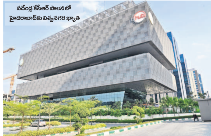
వందేళ్ల కేసీఆర్ పాలనలో హైదరాబాద్ కు విశ్వనగర ఖ్యాతి