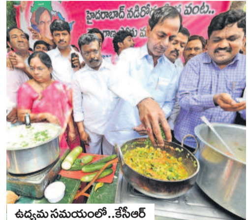
ఉద్యమ సమయంలో.. కేసీఆర్

తెలంగాణ రాష్ట్ర ఏర్పాటుతో కొత్త చరిత్ర, సరికొత్త శకానికి కేసీఆర్ ద్వారాలు తెరిచారు. కొత్త రాష్ట్రానికి రాజధాని అయిన హైదరాబాద్ నగరాన్ని అభివృద్ధి పథంలో వేలు పట్టి నడిపించారు. ఉమ్మడి పాలకులు కాసుల కోసం ఈ అందమైన నగరాన్ని విధ్వంసం చేస్తే.. ఒక్కొక్కటిగా పునర్ నిర్మిస్తూ విశ్వనగరంగా తీర్చిదిద్దేందుకు తన వంతు ప్రయత్నం చేశారు. విధిన్న జీవన విధానాలు, విలక్షణ సంస్కృతుల మేళావలన అభివృద్ధి మహానగరానికి కేసీఆర్ ఇచ్చారు. కేసీఆర్ దార్శనికతే హైదరాబాద్ నగరానికి శ్రీ రామ రక్షణ. నగరం రూపురేఖలు మార్చి విశ్వనగర కీర్తిని అందించారు.