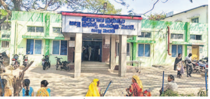
మెడకలోని జిల్లా కేంద్ర దవాఖానా

బనీయా, బ్లడ్ బ్యాంక్ ఉద్యోగులకు అందని వేతనాలు