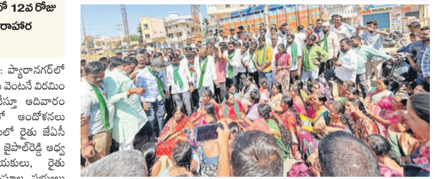
డంపింగ్ యార్డు అనుమతులు రద్దు చేయాలంటూ గుమ్మడిదలలోని హైవేపై మహిళలతో కలిసి ఆందోళన చేస్తున్న నర్సాపూర్ ఎమ్మెల్యే సునీతారెడ్డి

ప్యారానగర్లో డంపింగ్ యార్డును వ్యతిరేకిస్తూ ఉధృతమవుతున్న ఆందోళనలు