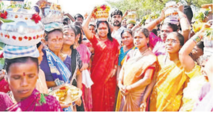
కొండపాక: రవీంద్రనగర్ వద్ద మహిళలతో కలిసి బోనమెత్తిన ఎమ్మెల్యే కవిత