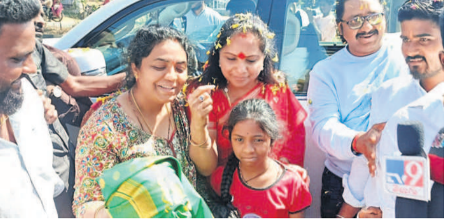
సిద్దిపేట: ఎమ్మెల్యే కవితకు ఘన స్వాగతం పలుకుతున్న తెలంగాణ జాగృతి కార్యకర్తలు