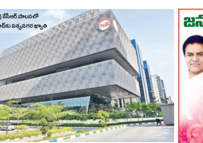
వందేళ్ల కేసీఆర్ పాలనలో హైదరాబాద్ కు విశ్వనగర ఖ్యాతి

మహానగరంలో.. సురక్షితమైన మంచినీటిని నిరంతరం అందించేందుకు జలమండలి వ్యవస్థను పునర్ వ్యవస్థీకరించారు. నీటి ఎద్దడి లేకుండా గోదావరి, కృష్ణా జలాలు నిరంతరం నగరంలో ప్రవహించేలా రింగ్ మెయిన్ ప్రాజెక్టును చేపట్టారు. అప్పటికి చుట్టూ వాటర్ రిజర్వాయర్లను నిర్మించి నగరానికి అవసరమైన నీటి వనరులను సమకూర్చారు. వీ హట్, టీఎస్ బీఎస్, పరిశ్రమలకు రోజూల వ్యవధిలో అనుమతులిచ్చేలా టీఎస్ బీఎస్ వంటివన్నీ కూడా కేసీఆర్ మేధావ్యుడనే నమ్మకం వచ్చినవే. ఒకనాటి సమయంలో ప్రధాని మోదీ నగరాభివృద్ధికి చిల్లీ గవ్వ కూడా కేటాయింపులతో యి.. రాష్ట్రానికే కాదు మిగతా రాజకీయవేదికల కేసీఆర్ చారిత్రక నగరాన్ని అభివృద్ధి పథంలో నడిపించారు.