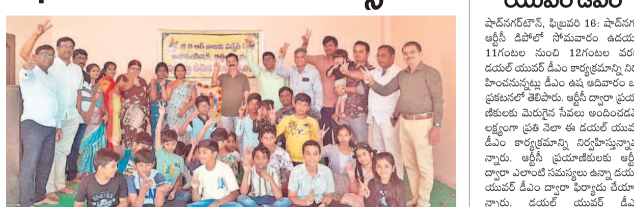
విద్యార్థులను ఆశీర్వదించిన తల్లిదండ్రులు, అసోసియేషన్ ప్రతినిధులు