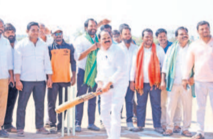
క్రికెట్ టోర్నీని ప్రారంభిస్తున్న ఎమ్మెల్యే