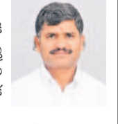
కాకి దశరథ్ ముదిరాజ్, బీఆర్ఎస్ సీనియర్ నాయకుడు

కందుకూరులో కూరగాయల మార్కెట్ను తక్షణమే వినియోగంలోకి తీసుకురావాలి. విక్రయదారులు నేటికీ రోడ్డుపైనే కూరగాయలను అమ్ముతున్నారు. ఇప్పటికైనా అధికారులు స్పందించి రైతులు, వ్యాపారులు కూరగాయలను రోడ్డు పైన విక్రయించకుండా మార్కెట్ షెడ్యూల్ విక్రయించే చర్యలు తీసుకోవాలి.