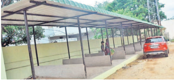
కందుకూరులో నిరుపయోగంగా ఉన్న కూరగాయల మార్కెట్ షెడ్యూల్

లయం పక్కనే ఉన్నా అధికారులు పట్టించుకోవడంలేదని సర్పంచి విమర్శలు చేస్తున్నారు. మార్కెట్లో కూరగాయలు విక్రయించడానికి