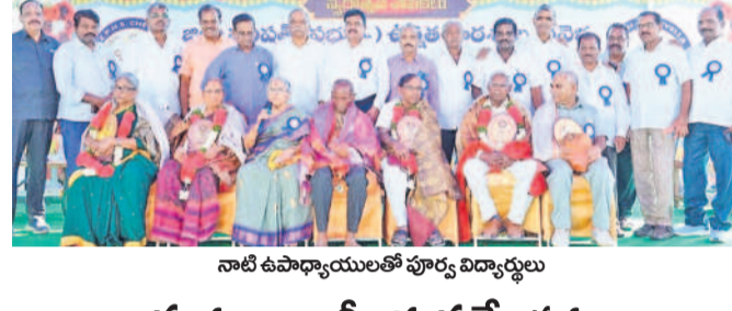
నాటి ఉపాధ్యాయులతో పూర్వ విద్యార్థులు