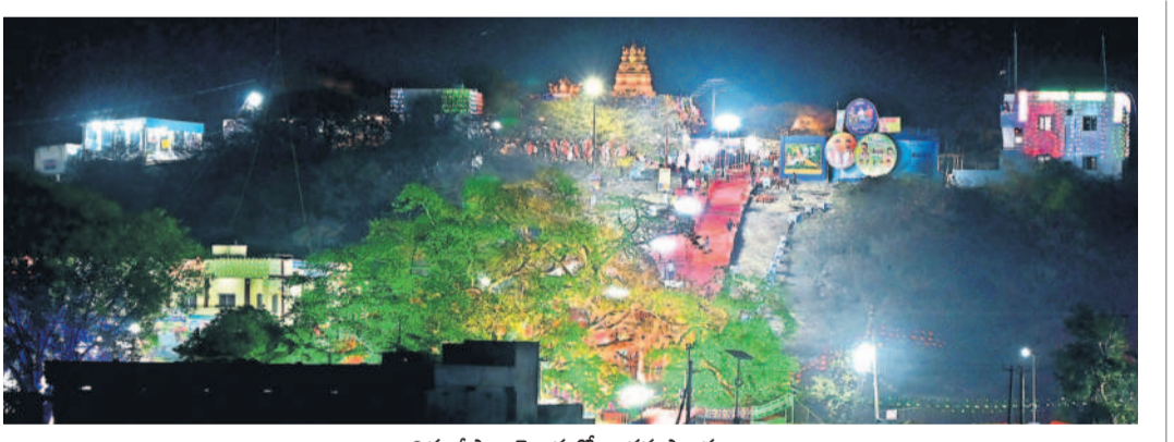
విద్యుద్దీపాల వెలుగులో జాతర ప్రాంగణం పెద్దగట్టుకు బారులు దీలన జనం