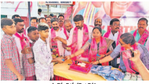
మీర్పేటలో కేక్ కట్ చేసి పంపిణీ చేస్తున్న బీఆర్ఎస్ అధ్యక్షుడు అర్జున్ కామేశ్వరెడ్డి