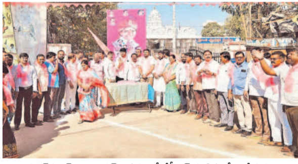
కర్నూలులో క్రాంతి ఆవరణలో కేసీఆర్ పుట్టిన రోజు వేడుకలు నిర్వహిస్తున్న బీఆర్ఎస్ శ్రేణులు