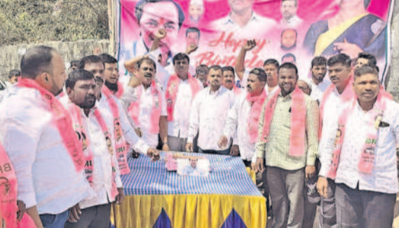
జిల్పల్లిలో జన్మదిన వేడుకలు నిర్వహిస్తున్న ముస్లిం మైనార్టీ నేతలు