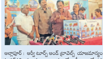
అల్లాపూర్ : ఆర్య్ ట్రావెల్స్ అండ్ ట్రావెల్స్ యాజమాన్యం కూకట్‌పల్లి ప్రధాన కార్యాలయంలో అక్కి డ్రాలో 10 మంది విజేతలను ప్రకటించారు. వారిని యూరోప్, దుబాయ్, బ్యాంకాక్ టూర్లకు ఉచితంగా తీసుకెళ్లమని ట్రావెల్స్ చైర్మన్ ఆర్య్ రమణ తెలిపారు.