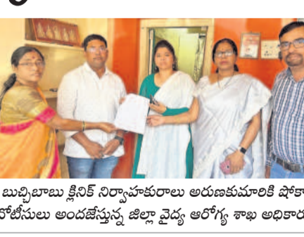
బుచ్చిబాబు క్లినిక్ నిర్వాహకులు అణకూరాలికి షోకాజ్ నోటీసులు అందజేస్తున్న జిల్లా వైద్య ఆరోగ్య శాఖ అధికారులు