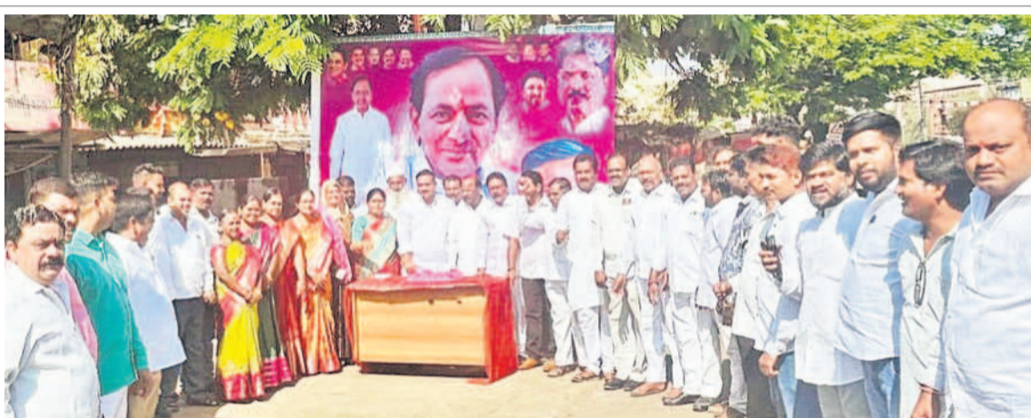
బాలాజీనగర్లో కేకేకట్ చేస్తున్న ఎమ్మెల్యే కృష్ణారావు, చిత్రంలో ఎమ్మెల్యే సవీనకుమార్, కార్పొరేటర్ రవీంద్రరెడ్డి