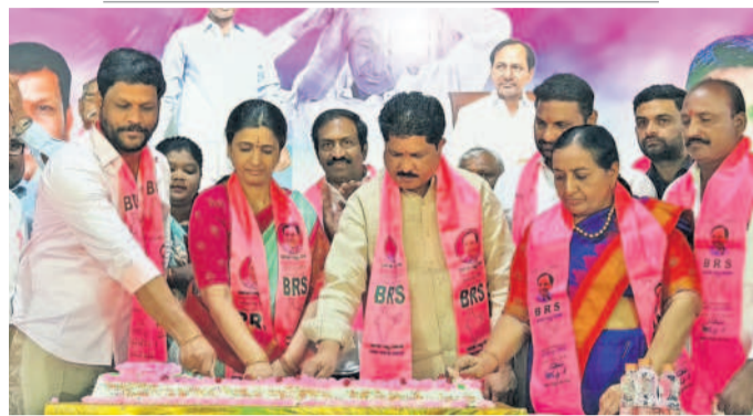
మియాపూర్ : అల్పిన్ కాలనీలో కేకేకట్ చేస్తున్న ఎమ్మెల్యే మాదవరం కృష్ణారావు, కార్పొరేటర్ మాధవరం రోజాదేవి, ఎర్రబెల్లి సతీశ్రావు, బీఆర్ఎస్ నాయకులు