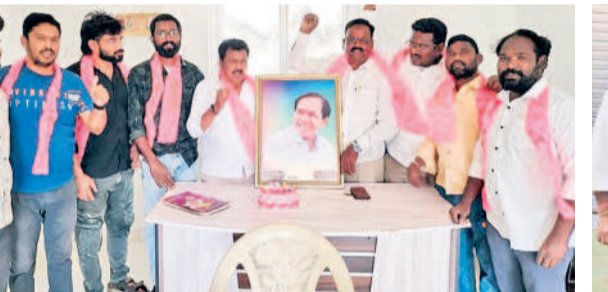
భూపాలపల్లి రూరల్ : వేడుకలు జరుపుకుంటున్న బీఆర్ఎస్ నాయకులు