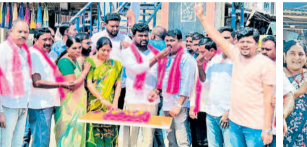
కాటారం : అంబేద్కర్ కూడలిలో కేక్ తినిపించుకుంటున్న నాయకులు