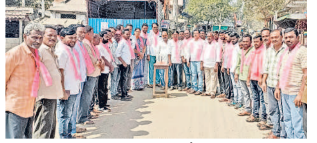
మహాదేవపూర : కేక్ కట్ చేస్తున్న బీఆర్ఎస్ శ్రేణులు