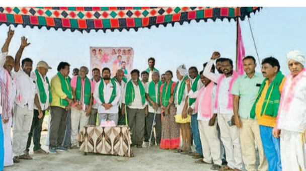
గోవిందరావుపేట : చల్వాయిలో కేక్ కట్ చేస్తున్న జడ్పీ చూడే షోర్ తీడర్, బీఆర్ఎస్ నాయకులు