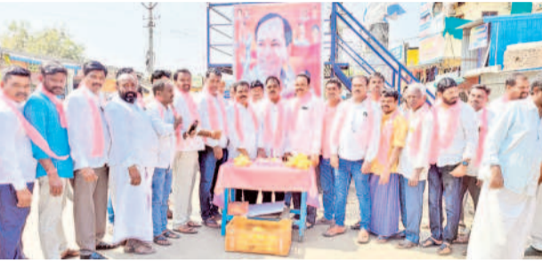
భీమపల్లి : కేసీఆర్ జన్మదిన వేడుకలలో పాల్గొన్న బీఆర్ఎస్ నాయకులు