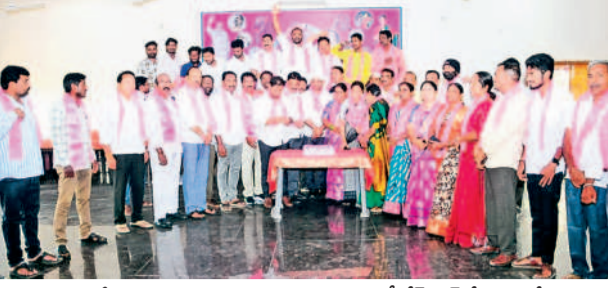
కృష్ణకాలనీ : భూపాలపల్లి పార్టీ కార్యాలయంలో కేక్ కట్ చేస్తున్న శ్రేణులు