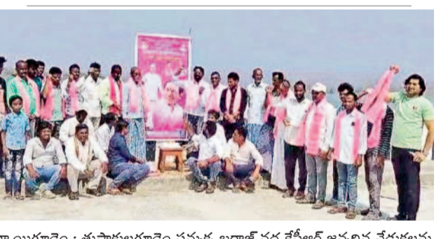
కన్నాయిగూడెం : తుపాలిగూడెం సమృద్ధి బుర్రా వద్ద కేసీఆర్ జన్మదిన వేడుకలను నిర్వహిస్తున్న బీఆర్ఎస్ నాయకులు