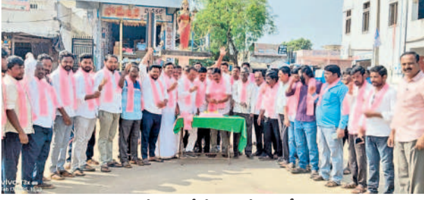
గణపతరం : మండల కేంద్రంలో కేక్ కట్ చేస్తున్న బీఆర్ఎస్ నాయకులు