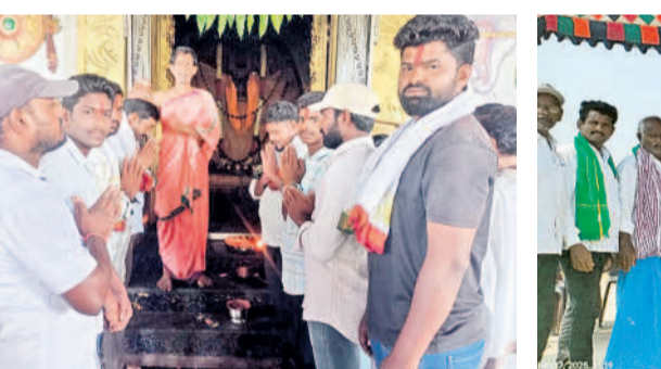
మంగుపేట : మల్లారం అలయంలో పూజలు చేస్తున్న నాయకులు