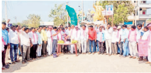
మొగుళ్లపల్లి : జన్మదిన వేడుకలు నిర్వహిస్తున్న బీఆర్ఎస్ శ్రేణులు