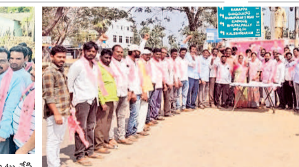
వెంకటాపూరం : కేక్ కట్ చేస్తున్న బీఆర్ఎస్ నాయకులు