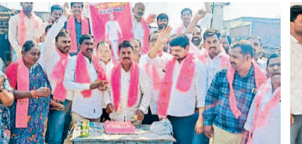
బిట్టూరు : సబబురాలు జరుపుకుంటున్న బీఆర్ఎస్ శ్రేణులు