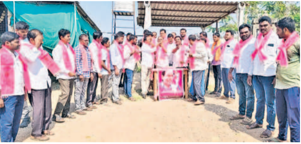
దేగొండ : మండల కేంద్రంలో కేక్ కట్ చేస్తున్న నాయకులు