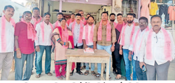
మల్లర : మామూర నింటలో కేక్ కట్ చేస్తున్న బీఆర్ఎస్ నాయకులు