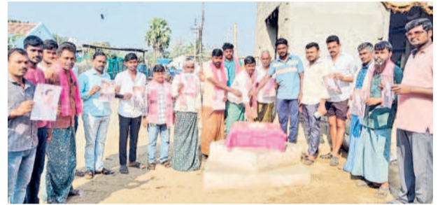
పలిమెల : కేక్ కట్ చేస్తున్న బీఆర్ఎస్ నాయకులు