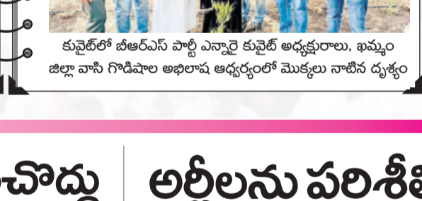
కువైట్ లో బీఆర్ఎస్ పార్టీ ఎన్నారై కువైట్ అధ్యక్షురాలు, ఖమ్మం జిల్లా వాని గొడిపాల అధికారి ఆధ్వర్యంలో మొక్కలు నాటిన దృశ్యం