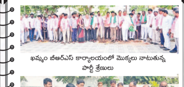
ఖమ్మం బీఆర్ఎస్ కార్యాలయంలో మొక్కలు నాటుతున్న పార్టీ శ్రేణులు