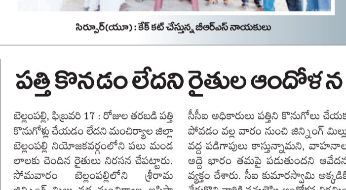
నన్నూరు (యూ) : కేక్ కట్ చేస్తున్న బీఆర్ఎస్ నాయకులు