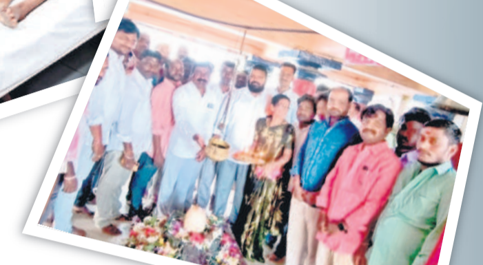
చెన్నూర్ : శివాలయంలో ప్రత్యేక పూజలు చేస్తున్న బీఆర్ఎస్ నాయకులు