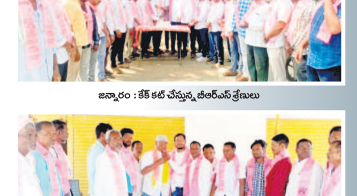
జన్నారం : కేక్ కట్ చేస్తున్న బీఆర్ఎస్ నాయకులు