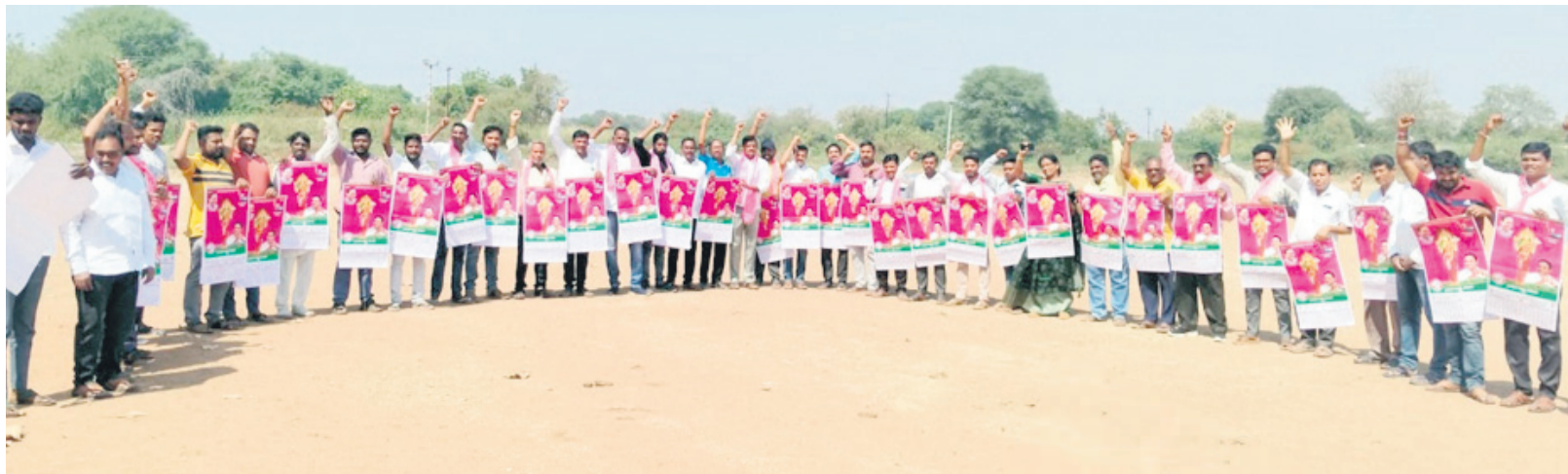
కాసిపేట : కేసీఆర్ పుట్టిన రోజు సందర్భంగా జిల్లాలోని కార్యకర్తలను విడుదల చేస్తున్న నాయకులు, కార్యకర్తలు