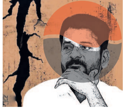
తన పేరు ఇంకా అంతగా పరిచయం చేసినవాడు, కాంగ్రెస్ పార్టీకి చెందినవాడు ఆ తరహా దుర్బలప్రాయంతో కూడిన వ్యాఖ్యలు చేయడం ఏమిటన్నది ఒకటి. ఇది సాధారణమే విషయం కాగా, 'బీహార్-బీహార్' అన్న ప్రస్తావనల ఉత్తర భారతదేశంలో, మరి ముఖ్యంగా ఆ రాష్ట్ర ప్రజలకు సంబంధించి చాలా సెసిటివ్ మాటలు. వారు వెనుకబడిన తెలంగాణ చదవనివారు, అల్లర్లు చేసినవారు, తగినంత సాంకేతికతలేని మొదటి మనుషులన్నది ఉత్తర భారత ప్రాంతాల కొందరి నుంచి విసిరివే ఆఖిరప్రాయం. ఇది ఒప్పుకుంటే తెలంగాణ ప్రజల గురించి ఉమ్మడి రాష్ట్రంలోని కొన్ని వారికి ఉండిన వైఖరి వంటిది. 'యేతో బీహార్ సాలా హై' అనే మాటలు స్వయంగా నేను అనేకసార్లు విన్నాను. నేను చదివిన జవహర్ లాల్ నెహ్రూ యోగినియల్ (జేఎన్ఎం) వంటి విశిష్టమైన విద్యా సంస్థలోనూ ఈ వైఖరులు కనిపించేవి. మొత్తం మీద ఈ పరిస్థితులు బీహార్ ప్రజలకు చాలా సెసిటివ్ టీకా మారాయి. సరే ఇవన్నీ రేవంత్ రెడ్డికి తెలియలేవని, కానీ 'బీహార్ డీఎన్ఎ' అన్న మాట ఆయన నోట రావడం ఏమిటన్నది ప్రశ్న. నిజానికి చరిత్రలోకి వెళితే, బీహార్ భూమికి అనేక మిథానైన ఘనతలున్నాయి. దేశంలో మొట్టమొదటిది ఆయన మగడ సామ్రాజ్యం, బౌద్ధమత ఆవిర్భావం, మహావిశ్వవిద్యాలయాల స్థాపన మొదలైనవి. విషయానికి మొత్తం మీద ఇది రెండవ కోణం అయింది. రేవంత్ రెడ్డికి తన పాపాలు అర్థమై ఉంటే, కనీసం దీనిపై విషయాలు వచ్చిన వెంటనే, తనకు దురుద్దేశాలు లేవని, మాట తొందరలో అలా వచ్చిందని అవలంబించి. కానీ, అదేమీ చేసినట్లు లేదు. ఆ విధంగా ఆయన మొదటిసారి నెపాదించుకున్న దేశవ్యాప్త ప్రతిష్ట అలాగే నిలిపిపోయింది.

'బీహార్ డీఎన్ఎ' విషయం తెలిసినది. రేవంత్ రెడ్డి ఆధికారానికి వచ్చే సమయానికి రాష్ట్ర అధికార యంత్రాంగంలోని ఇఎంఐ, ఇఎస్ఐ, ఇఎస్ఐ అధికారులతో కొందరు బీహార్ వెండిసారు ఉన్నారు. సీనియర్ కారకణంగా వారిలో కొందరు ముఖ్యమంత్రిని సాధారణంగా పనిచేస్తున్నారు. అఖిల భారత సర్వేయం అధికారుల ఎంకె, వారిని వివిధ రాష్ట్రాలకు కేటాయించడం కేంద్ర హోంకార్య శాఖ. సర్కార్ వల్లభాచార్యుల వంటి మొదటి హోంమంత్రిగా ఉండటం కాకుండా సుందర్ కేంద్రమంత్రిగా పనిచేస్తున్నది. ఆయన కార్యాలయంలో బీహార్ కు చెందినవారు ఉండటం అనే స్వయంగా వారికి గాని, అప్పుటి బీహార్ ప్రభుత్వానికి గాని ఎటువంటి ప్రయోజనం లేదు. ఉత్తరప్రదేశ్, రాజస్థాన్, ఒడిశా, తమిళనాడు, పశ్చిమ బెంగాల్ వంటి ఇతర రాష్ట్రాలకు చెందిన వారి విషయంలోనూ అంతే. వీరందరూ కూడా ఉమ్మడి ఏపీలోనూ ఉండేవారు. తెలంగాణ పరిస్థితి అదే.