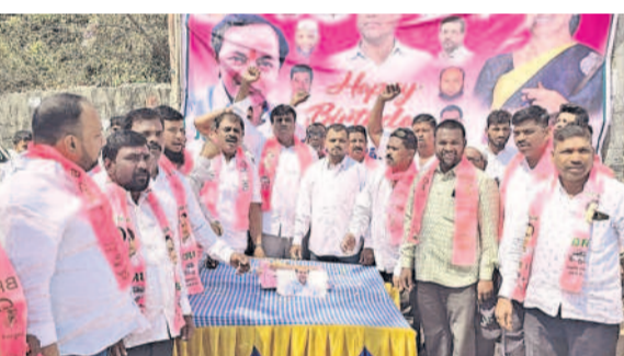
జిల్పల్లిలో జన్మదిన వేడుకలు నిర్వహిస్తున్న ముస్లిం మైనార్టీ నేతలు