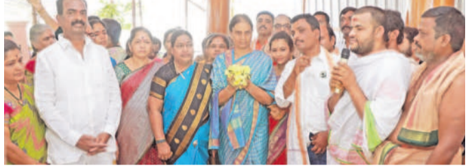
బడంగపేట, ఫిబ్రవరి 17: బడంగపేట మున్సిపల్ కార్పొరేషన్ పరిధిలో సీతారామాంజనేయ దేవస్థానం పూజ వార్షికోత్సవం సందర్భంగా ఎమ్మెల్యే సతీతా ఇంద్రారెడ్డి ప్రత్యేక పూజలు చేశారు. ఈ కార్యక్రమంలో