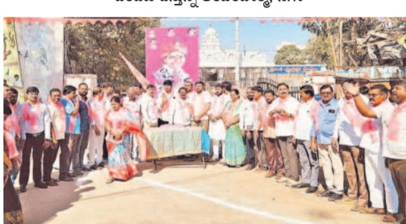
కర్నూలులో క్రాంతి ఆవరణలో కేసీఆర్ పుట్టిన రోజు వేడుకలు నిర్వహిస్తున్న బీఆర్ఎస్ శ్రేణులు