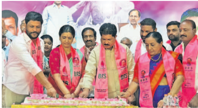
మియాపూర్ : అల్పిన్ కాలనీలో కేకేకట్ చేస్తున్న ఎమ్మెల్యే మాదవరం కృష్ణారావు, కార్పొరేటర్ మాధవరం రోజాదేవి, ఎర్రబెల్లి సతీశ్రామ్, బీఆర్ఎస్ నాయకులు