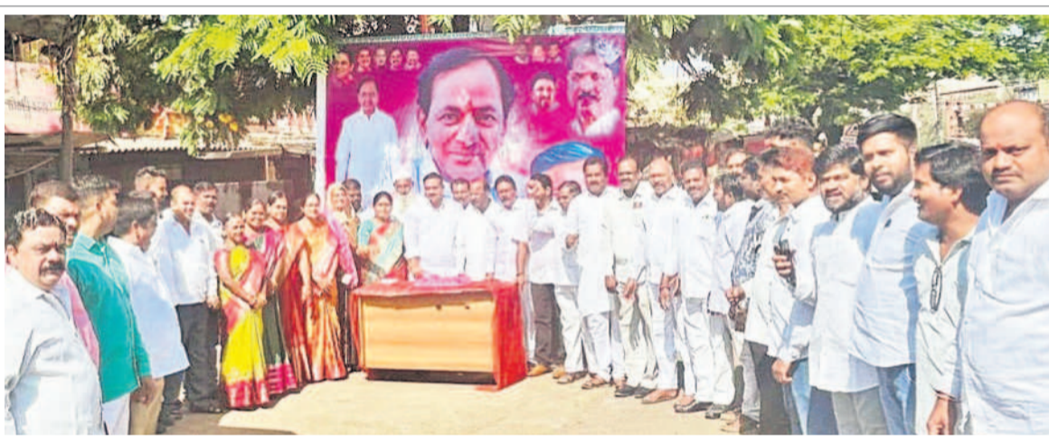
బాలానగర్లో కేకేకట్ చేస్తున్న ఎమ్మెల్యే కృష్ణారావు, చిత్రంలో ఎమ్మెల్యే సవీనకుమార్, కార్పొరేటర్ రవీంద్రరెడ్డి