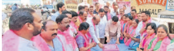
బాలానగర్ : ఫతేనగర్లో కార్పొరేటర్ సతీశ్రామ్, బీఆర్ఎస్ శ్రేణుల ఆధ్వర్యంలో కేకే కట్ చేస్తున్న ఎమ్మెల్యే మాదవరం