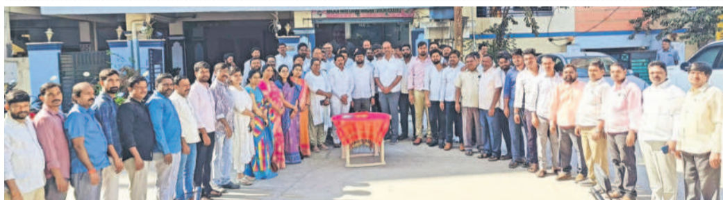
నిజాంపేటలో జరిగిన కేసీఆర్ జన్మదిన వేడుకల్లో భాగంగా కేకే కట్ చేసే సంబురాలు జరుపుకుంటున్న బీఆర్ఎస్ నాయకులు