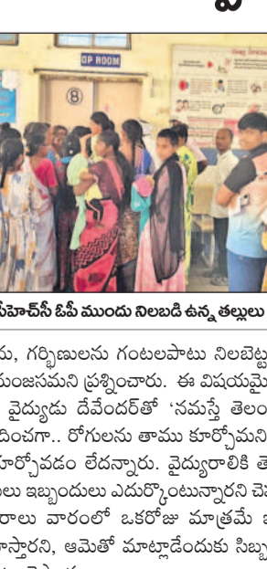
చేర్యాల సీహెచ్ఎస్ ఓపీ ముందు నిలబడి ఉన్న తల్లులు