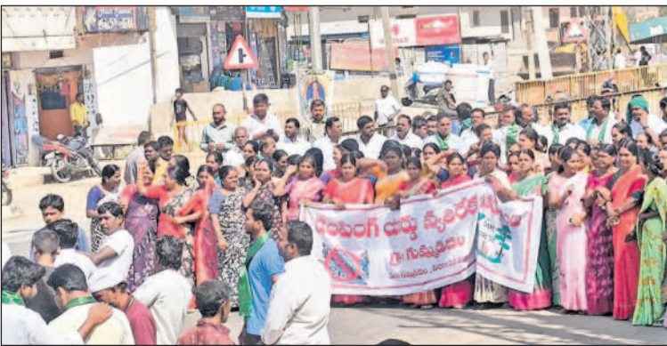
డంపింగ్ యార్డు అనుమతులు రద్దు చేయాలంటూ గుమ్మడిదలలో మహిళల భారీ ర్యాలీ