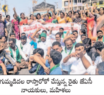
గుమ్మడిదల రాస్ట్రాలో చేస్తున్న రైతు జేపీసీ నాయకులు, మహిళలు