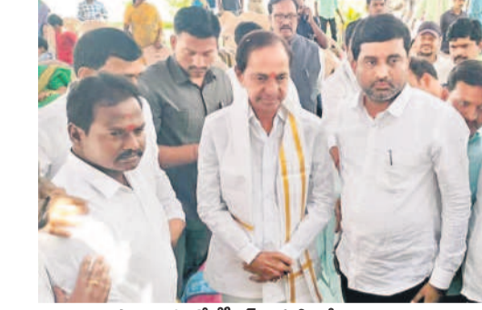
పాములపల్లిలో కేసీఆర్ కు పుట్టినరోజు శుభాకాంక్షలు తెలుపుతున్న ముక్కా కరుణారెడ్డి