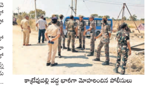
కార్యక్రమం వద్ద భూమి మోహించిన పోలీసులు

నారాయణ్ కోడంగల్ ఎత్తి పోతల పథకం చేపట్టేందుకు మక్తల్ మండలం కార్యక్రమం మొదటి దశ పంపిణీని నిర్మాణం, భూసేకరణ అధికారులు చేస్తున్న సర్వే భారీ పోలీస్ బందోబస్తు మధ్య కొనసాగింది. సర్వే ప్రక్రియను నారాయణ్ కోడంగల్ పోలీసులు పరిశీలించి, రైతులను ఎవరికి సర్వే చేస్తున్న అధికారుల దగ్గరకు వెళ్లమంటూ నివారించారు. ఎవైనా బాధ కలిగితే పోలీస్ స్టేషన్ కు వెళ్లాలని మాకు పోలీస్ వాళ్ల రైతులను అడ్డుకొని సర్వే చేయడానికి సహకారం చేస్తున్నారని పలువురు రైతులు ఆవేదన వ్యక్తం చేశారు.