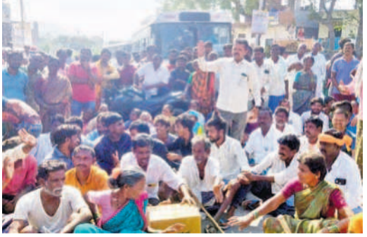
అన్నారంలో రోడ్డుపై బైరా యిటు నిరసన తెలుపుతున్న రైతులు

పానగల్, ఫిబ్రవరి 17: ఎంజీకెఎల్ఎస్ డిస్ట్రిబ్యూట్ 8-8, మేజర్ కె నాల్-4 ద్వారా మండలంలోని వివిధ గ్రామాలకు పంటపోలాలకు సాగునీరు అందించాలని సోమవారం రైతులు ప్రధాన రోడ్డుపై బైరా యిటు ధర్నా నిరసన చేపట్టారు. కాల్యంలో పూడిత తపనను చేపట్టక పోకుండా, అక్కడక్కడా లింక్ కాలనలను పూర్తి చేయకపోవడంతో సాగునీరు అందడం లేదని రైతులు ఆగ్రహించారు. ప్రజాప్రతినిధులు నిమగ్నమై వ్యవసాయం చేయడం కోసం సమస్యలను పరిష్కరించేందుకు వాటిని పూర్తి చేయాలని డిమాండ్ చేశారు. కాల్యం పనులు పదిరోజు పూర్తి చేసి సాగునీరు అందాలని వ్యవసాయకర్తలను ఆగ్రహించారు. అనంతరం బీఆర్ఎస్ ఎన్టీసీ జిల్లా అధ్యక్షుడు చంద్రశేఖర్ నాయక్ మాట్లాడుతూ.. కాల్యం పనులలో పనులను త్వరితగతిన పూర్తి చేసేందుకు మంత్రి జూపల్లి కృష్ణారావు ప్రత్యేక చొరవ తీసుకోవాలని డిమాండ్ చేశారు. రామన్నగట్టు రిజర్వాయర్ మంత్రి జూపల్లి కృష్ణారావు రద్దు చేయించాలని, రిజర్వాయర్ రద్దయిన తరువాత తిరిగి పునరుద్ధరణ చేయాలని డిమాండ్ చేశారు. కార్యక్రమంలో ఇంజనీర్ డి.కె. వెంకటరమణ శర్మ, ఎస్పీ శ్రీనివాస రెడ్డి, రైతులు తరలివచ్చి పాల్గొన్నారు.