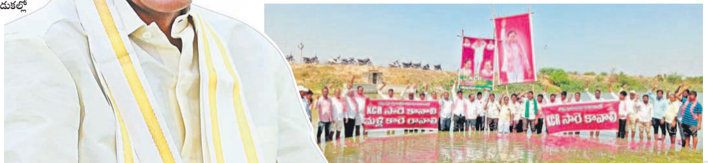
గోపాల్ పేట అయ్యలపల్లె వద్ద కేసీఆర్ ఫెక్సిలతో జన్మదిన వేడుకలు నిర్వహిస్తున్న రైతులు, బీఆర్ఎస్ నేతలు