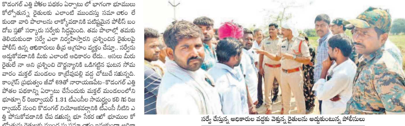
సర్వే చేస్తున్న అధికారుల వద్దకు వెళ్తున్న రైతులను అడ్డుకుంటున్న పోలీసులు