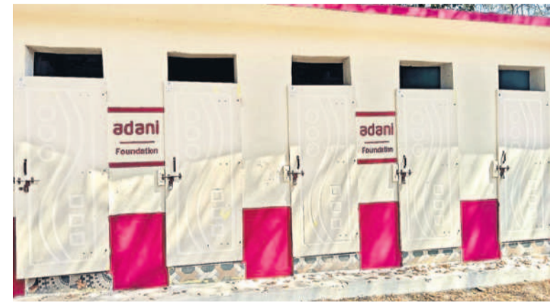
జానపహాడీ గ్రామంలో ప్రభుత్వం నిర్మించిన మరుగుదొడ్లకు అదానీ ఫౌండేషన్ పేరు

లపై పోలుముంతలు ఉంచి, రెండు మట్టి కంచు దులో నెయ్యి, సువ్వల నూనె పోసి దీపారాధన చేశారు. బైరం అకారంలో వేసిన ముగ్గులపై కుర్ర పిల్లలు పోటిత్తారు. ఆదివారం జిల్లా రాత్రి నుంచి లక్షలాదిగా భక్తులు గుట్టపైకి చేరుకున్నారు. తమ ఇష్ట దైవానికి బోనాలు సమర్పించి మొక్కలు తీర్చుకున్నారు. సోమవారం జాతరలో అయిన మద్దెపోలు, ముత్యాలపోలు, లగ్గంపోలు కార్యక్రమం నిర్వహించారు. బైకాని వారు వాయిద్యాల వాయిస్తూ గొల్లల చరిత్రను కథల రూపంలో తెలియజేస్తూ ఆయనాహుక్కు దారులైన ముప్ప, వెంకటబొయిన వారి సమక్షంలో మద్దె పోలు నిర్వహించారు. బైకాని ప్రధాన పూజారి లింగమంతుల స్వామి సమర్పించిన మహిళలు గుడి ముట్ట పొద్దు పెట్టి ముందు పసుపుతో ముగ్గులు వేశారు. ముగ్గు