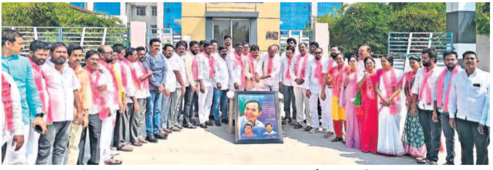
సూర్యాపేట ప్రభుత్వ మెడికల్ కళాశాల ఎదుట కేక్ కట్ చేస్తున్న మాజీ ఎంపీ బుద్దుగల, బీఆర్ఎస్ శ్రేణులు