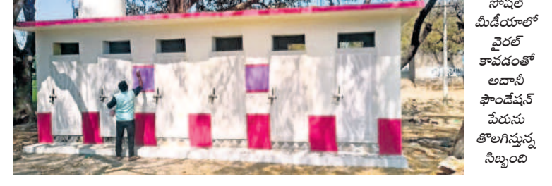
సోషల్ మీడియాలో వైరల్ అవడంతో అదానీ ఫౌండేషన్ పేరు పెట్టిన తొంగిగిన్న సిబ్బంది

సంస్థ అధికారులు దూర వద్ద మౌలిక పనులకు కల్పనకు కొంత ఆర్థికసాయం చేశారు. దీన్ని అవకాశంగా తీసుకున్న కొందరు స్థానిక నాయకులు అది కారణంతో కుమ్మక్కై ప్రభుత్వ అధ్యక్షులకు నిర్మించిన మరుగుదొడ్లకు అదానీ సంస్థ కట్టించినట్లు పేరు పెట్టారు. దీంతో గ్రామస్థులు గమనించి సోషల్ మీడియాలో వైరల్ చేయడంతో స్థానిక నాయకుడు కల్పించుకొని మరుగుదొడ్డు ఉన్న అదానీ సంస్థ చేరుకుని తీయించారు. జిల్లా అధికారులు దీనిపై విచారణ జరిపి బాధ్యులపై చర్యలు తీసుకోవాలని స్థానికులు కోరుతున్నారు. దగ్గ ఇన్ స్పెక్టర్ మామూడే మాట్లాడుతూ ప్రభుత్వం దగ్గ వద్ద ప్రభుత్వం ఇటీవలే రూ.కోటితో పోలిట్ సంస్థ పేరు రాయింపడం నిజమేనని, దాన్ని ఆడ్డకొని సంస్థ పేరు తొలగించినట్లు ఆయన తెలిపారు.